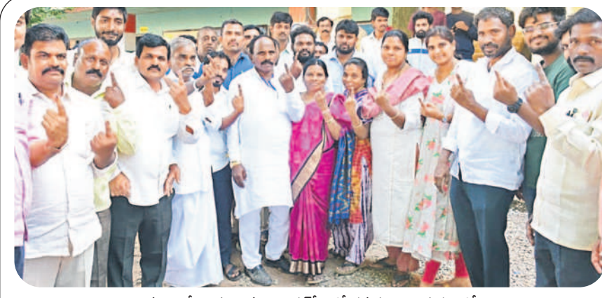
సహాయపేట: స్వగ్రామం బిందలపేటలో తన కుటుంబ సభ్యులతో కలిసి ఓటు హక్కు వినియోగించుకున్న చేమేళ్ల ఎమ్మెల్యే యాదయ్య