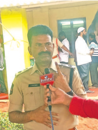
ఓటు హక్కును వినియోగించుకుని మీడియాతో మాట్లాడుతున్న వికారాబాద్ ఎస్సీ కోటిరెడ్డి