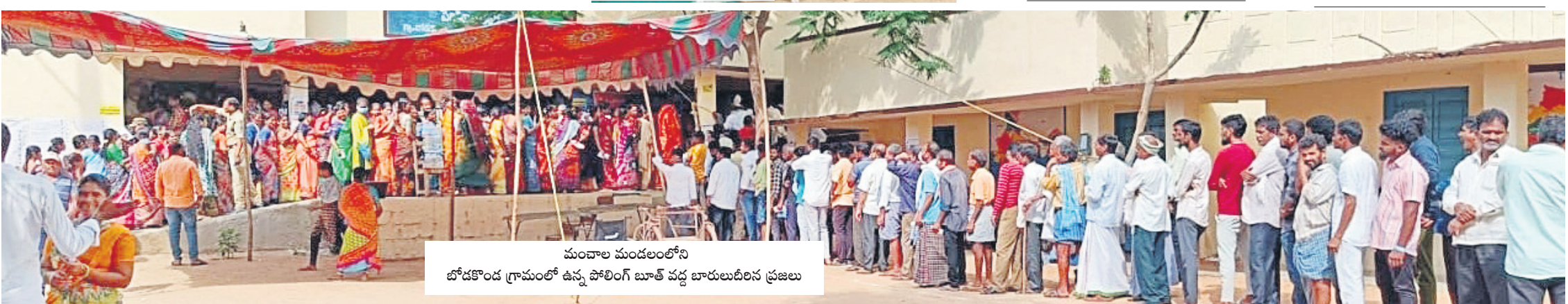
మంచాల మండలంలోని బోడకొండ గ్రామంలో ఉన్న పోలింగ్ బూత్ వద్ద బారులుదీరిన ప్రజలు