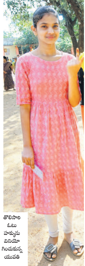
తోలిసాలి ఓటు హక్కును వినియోగించుకున్న యువతి