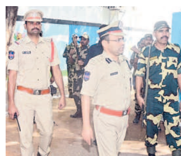
హనుమకొండలోని మర్కజీ స్కూల్లో పాలింగ్ కేంద్రాన్ని పరిశీలిస్తున్న సీపీ అంబర్ కిశోర్ రూ