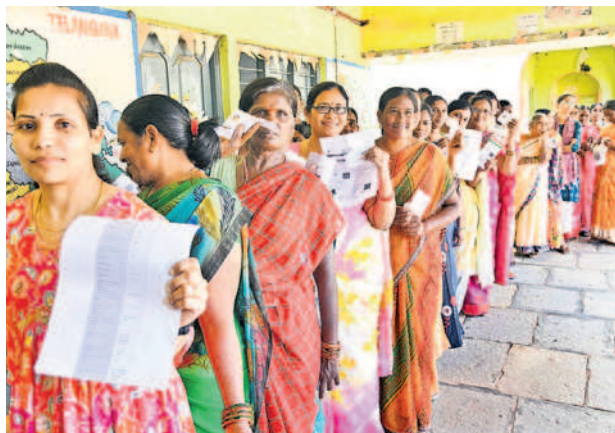
న్యూశాయంపేట ప్రభుత్వ స్కూల్లోని పాలింగ్ కేంద్రంలో క్యూలో ఓటర్లు