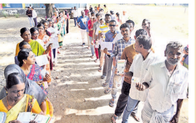
ధర్మసాగర్ ప్రభుత్వ పాఠశాలలోని పోలింగ్ కేంద్రంలో క్యూలో ఉన్న ఓటర్లు

కొత్త అనుభూతి.. జయశంకర్ భూపాలపల్లి, నవంబర్ 30 (నమస్తే తెలంగాణ) : నాకు కొత్తగా ఓటు హక్కు వచ్చింది. మొదటిసారి పోలింగ్ కేంద్రంలో అడుగుపెట్టి ఓటు వేయడం కొత్త అనుభూతినిచ్చింది. చాలా సంతోషంగా ఉంది. భూపాల పల్లిలోని రెస్టారెంట్ స్టేషన్లో ఓటు వేశాను. ప్రజాస్వామ్యంలో ఓటు చాలా విలువైనది.