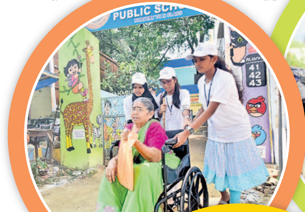
జేపీఎన్ రోడ్లో వీల్చైర్లో వృద్ధురాలిని గొర్లపేటలో ఓటు వేసి వెలికున్న తీసుకొస్తున్న వలంటీర్లు సీరాను చూపుతున్న లైకు