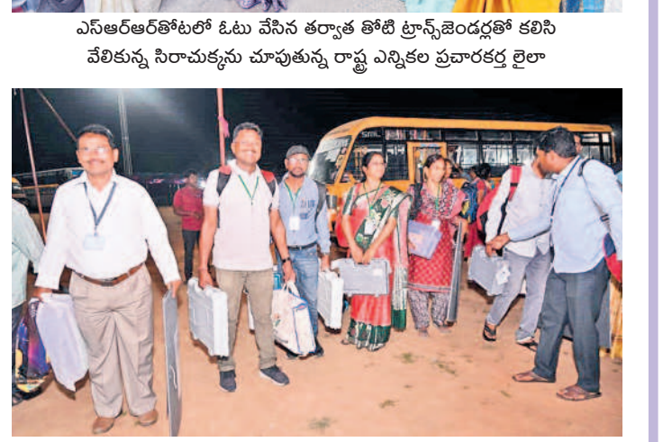
పోలింగ్ కేంద్రాల నుంచి సామగ్రిని భూపాలపల్లికి తీసుకొస్తున్న సిబ్బంది