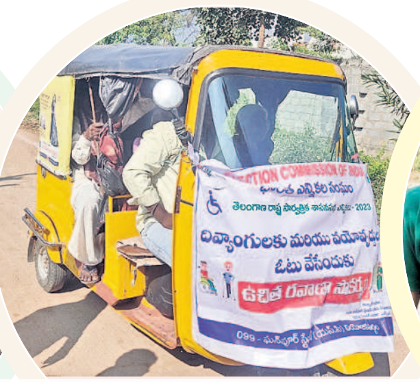
రఘునాథపల్లి : ఆటోలో ఉచితంగా దివ్యాంగులను తరలిస్తూ..