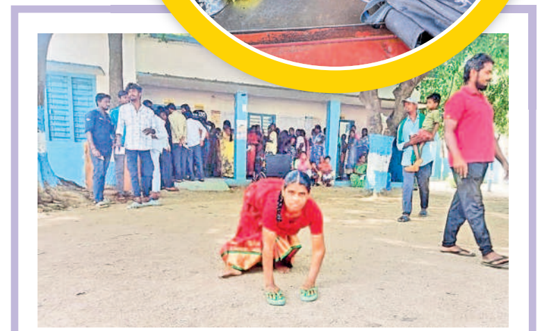
నర్సంపేట రూరల్ : ఓటింగ్ కు ఉత్సాహంగా వస్తున్న దివ్యాంగురాలు