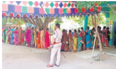
కూసుమంచి: తొలిసారి ఓటు వినియోగించుకున్న యువత, చింతకాని: నాగులవంచ, రామకృష్ణాపురంలో బారులు తీరిన ఓటర్లు

కూసుమంచి, డిసెంబర్ 1: పాలేరు నియోజకవర్గంలో తుది ఓటర్ల జాబితా ప్రకారం యువ ఓటర్లు 27.50 శాతం ఉన్నారు. 39 వేల మందికిపైగా కొత్తగా ఓటు హక్కు సమోదాయం చేసుకున్నారు. ఈసారి ఎన్నికల్లో అధికంగా యూత్ ఓటర్లు ఉన్నారు. గురువారం జరిగిన పోలింగ్లో అధికంగా యువతే పాల్గొన్నారు. జిల్లాలోనే అత్యధికంగా 65వేల మంది యువ ఓటర్లు గల పాలేరు నియోజకవర్గంగా ఉంది. మొత్తం ఓటర్లలో 65వేల మంది యువ ఓటర్లు ఉన్నారు. పాలేరులో 27.50 శాతం మంది యూత్ ఓటు హక్కు సమోదాయం చేసుకున్నారు. నాలుగు మండలాల్లో యువ ఓటర్లు పోలింగ్ సమయంలో ఎక్కువగా ఓటు హక్కు వినియోగించుకున్నారు. దీంతో నియోజకవర్గ ఫలితాలపై యువ ఓటర్ల ముద్ర పడనుంది.