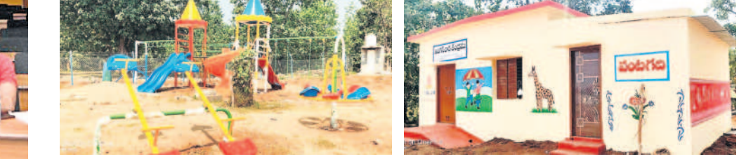
చిన్నారుల కోసం ఏర్పాటు చేసిన ఆటవస్తువులు అంగ్లవాడీ కేంద్రం

ఇండ్ల నిర్మాణం, వ్యవసాయ భూమిని కేటాయింపిన సకల సౌకర్యాలు కల్పించిన ప్రభుత్వానికి మా 94 కుటుంబాలు రుణపడి ఉంటుంది. అడవిలో ఉండే మాకు ఇలాంటి సౌకర్యాలు కల్పించి, మమ్మల్ని ఆదుతున్న సర్కారుకు ధన్యవాదాలు.