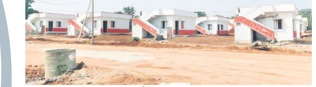
కొత్తమట్టపడగలో నిర్మించిన డబుల్ బెడ్రూం ఇండ్లు

94 ఇండ్ల నిర్మాణం, కుటుంబానికి 3 ఎకరాల భూమి ప్రారంభానికి సిద్ధంగా ఇండ్లు