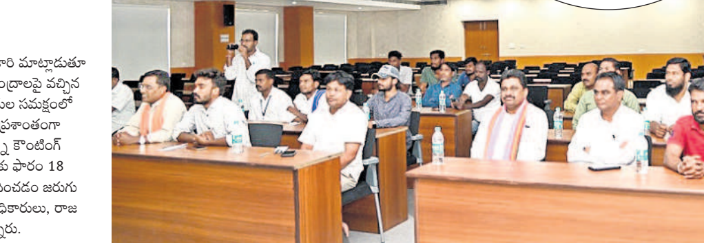
ఎన్నికల విభాగం అధికారులు, రాజకీయ పార్టీల ప్రతినిధులు