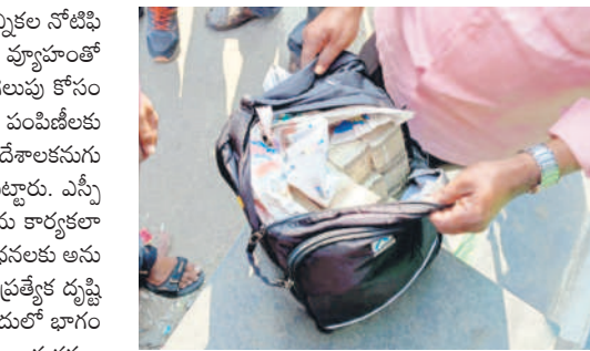
పోలీసులు పట్టుకున్న రూ. 50 లక్షల (ఫైల్)

త్వక పోలింగ్ కేంద్రాల వద్ద భారీ బందోబస్తును ఏర్పాటు చేశారు. హోరాహోరీగా సాగిన ఎన్నికల పోరులో ఎలాంటి వివాదాలకు తావు లేకుండా జిల్లా పోలీసులు ఎంతో సమన్వయంతో వ్యవహరించడం వల్లనే ఎన్నికల ప్రశాంత వాతావరణంలో జరిగాయని పులవూరు జిల్లా పోలీసుల ప్రశంసలు స్వాధీనం చేసుకున్నారు.