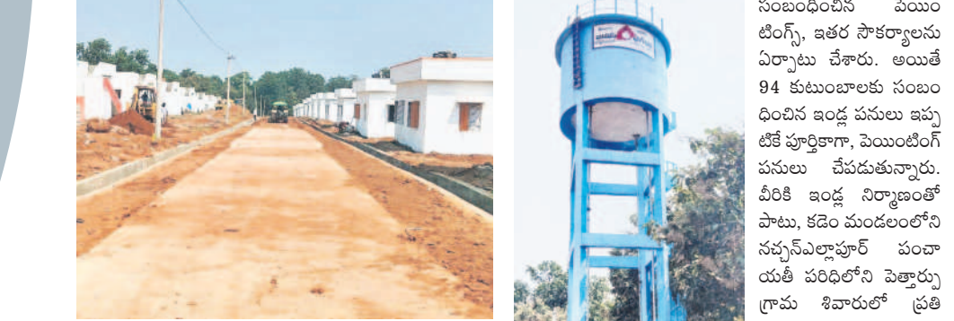
కొత్తగా వేసిన సీస రోడ్లు, మురుగు కాలువలు

కడెం, డిసెంబర్ 1: దేశంలో 42వ బ్లైగ్ రిజోన్ (కవ్వూల్ ఆభయారణ్యం) ఏర్పాటు కావడంతో నిర్మల్ జిల్లాలోని కడెం, దస్తూరాబాద్ మండలాలతో పాటు, మంచీర్యాల జిల్లాలోని జన్యారం మండలాల్లోని 23 గ్రామాలను ఈ ప్రాంతం అటవీ నుంచి ఖాళీ చేయించి వారిని ఇతర ప్రాంతాలకు తరలించనున్నారు. అయితే అనేక ఇండ్ల పాటు ఆడవిలో తీవ్రస్థాయి అదివాసీల మొదటగా ఈ ప్రాంతాలను ఖాళీ చేయడానికి ఆసక్తి చూపలేదు. కానీ ప్రభుత్వం ముందుకొచ్చి వారికి మెరుగైన సౌకర్యాలు కల్పిస్తామని హామీ ఇవ్వడంతో అదివాసీలు వెళ్లడానికి ఆసక్తి చూపించారు. వనాన్న సమ్మకాని అటవీ సంపద ద్వారా తడకలు, బుట్టలు, ఇతర పండ్లను సేకరిస్తూ, వాటిని అమ్ముకుంటూ జీవనం సాగించిన వారికి ప్రభుత్వం పునరావాసం పేరిట మెరుగైన సౌకర్యాలను కల్పించనుంది. ఇందులో భాగంగా ఆభయారణ్యం పరిధిలోని కడెం మండలంలోని రాంపూర్, మైసంపేట గ్రామాలను మొదటి విడుదల కింద ఎంపిక చేసిన అటవీశాఖ అధికారులు ఈ గ్రామాలు పూర్తి అటవీ ప్రాంతంలో ఉండడంతో వాటిని ముందుగా తరలించాలని నిర్ణయించారు.