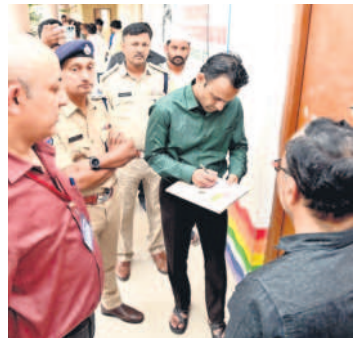
స్టాండ్ రూములను సీల్ చేస్తున్న కలెక్టర్, ఎన్సీ, అధికారులు

గురువారం నాటి పోలింగ్ లో ఎన్నికల నిర్వహణలో ముఖ్యపాత్రలు ముగిశాయి. ఇక మిగిలిపోయిన పోలింగ్ కేంద్రాల్లో క్యూలైన్ లో నిల్వన్న వారికి ఓటు వేసే అవకాశం కల్పించారు. పోలింగ్ తీరును జిల్లా ఎన్నికల అధికారులు ఎప్పటికప్పుడూ గమనిస్తూ అధికారులు, సిబ్బందికి తగిన సలహాలు, సూచనలు అందజేశారు. పోలింగ్ కేంద్రాల వద్ద పకడ్బందీ ఏర్పాట్లు చేశారు. ఉమ్మడి జిల్లా వ్యాప్తంగా బోధ నియోజకవర్గంలో అత్యధికంగా 82.86 శాతం, మంచీర్యాలలో అతి తక్కువగా 69.06 శాతం పోలింగ్ నమోదైంది. పోలింగ్ అనంతరం అధికారులు ఈవీఎంలు, వీవీ ప్యాట్లు, కంప్యూటర్ యూనిట్లను ఆయా నియోజకవర్గాల్లో ఏర్పాటు చేసిన స్టాండ్ రూములకు తరలించారు. 10 నియోజకవర్గాల్లో ఏర్పాటు చేసిన స్టాండ్ రూములలో అధికారులు భద్రపర్చి సీల్ చేశారు. స్టాండ్ రూముల వద్ద పటిష్టమైన పోలీసు బందోబస్తు ఏర్పాటు చేశారు. జిల్లా ఎన్నికల శుభ్రతలకు స్టాండ్ రూములను పరిశీలించి భద్రతను పరిశీలించారు.