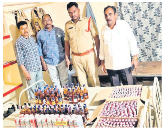
బి ఇంట్లో అక్రమంగా నిల్వ ఉంచిన మద్యాన్ని సీజ్ చేసిన పోలీసులు (ఫైల్)