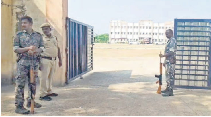
ఆసిఫాబాద్ లో సోషల్ వెల్ఫేర్ రెసిడెన్షియల్ లో ఏర్పాటు చేసిన స్టాండ్ రూం