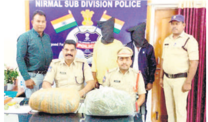
అక్రమంగా తరలిస్తున్న గంజాయిని స్వాధీనం చేసుకున్న పోలీసులు (ఫైల్)