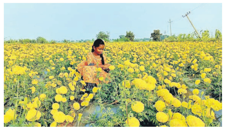
కొలనూర్లలో సాగు చేసిన బంతి పూల తోటలో చిన్మాల