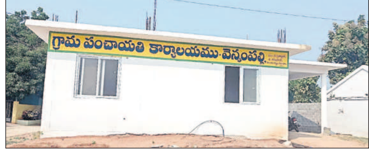
వెన్నంపల్లి గ్రామ పంచాయతీ కార్యాలయం