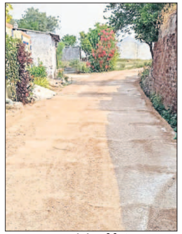
గ్రామంలో వేసిన సీసీరోడ్లు

రెడ్డి ఆధ్వర్యంలోని పాలకవర్గం ప్రభుత్వ పథకాలను ప్రజలకు అందించడంతోపాటు పచ్చదనం పరిశుభ్రతపై అవగాహన కల్పిస్తూ గ్రామాన్ని ఆదర్శంగా నిలుపుతున్నది. గ్రామంలో విద్యుత్ సమస్య ఉండడంతో సుమారు రెండు రూ. కోట్లతో గ్రామంలో సబ్స్టేషన్ నిర్మించి సమస్య పరిష్కరించారు. ప్రభుత్వం ద్వారా 32 లక్షల రూపాయలు మంజూరు కాగా, నూతన గ్రామపంచాయతీని నిర్మించుకున్నారు. అంతర్గత రహదారుల కోసం ప్రభుత్వం నుంచి సుమారు కోటి రెండు లక్షల రూపాయలు మంజూరు కాగా, వాటితో సీసీరోడ్లు నిర్మించారు.