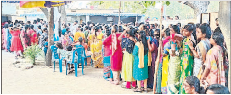
హుజూరాబాద్ పట్టణ పరిధిలోని ఇందిరానగర్ లో ఓటు వేసేందుకు బారులు తీసిన ఓటర్లు(ఫైల్)

హుజూరాబాద్, డిసెంబర్ 1: 2018 అసెంబ్లీ ఎన్నికలతో పోల్చితే ఇప్పుడు నియోజకవర్గంలో పోలింగ్ శాతం స్వల్పంగా తగ్గింది. 2018 హుజూరాబాద్ నియోజకవర్గానికి జరిగిన సాధారణ ఎన్నికల్లో 84 శాతం ఓటింగ్ కాగా, ప్రస్తుతం 83.19 శాతం నమోదైంది. గతంతో పోల్చుకుంటే 0.81 శాతం తక్కువగా పోలింగ్ జరిగింది. 2018 జరిగిన ఎన్నికల్లో మొత్తం పదిమంది బరిలో