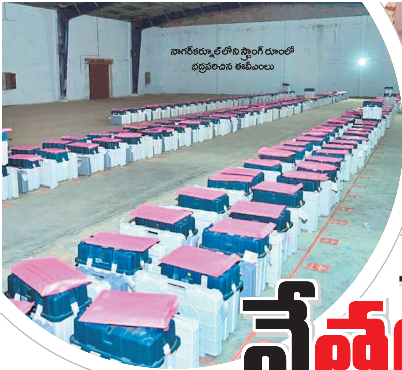
నాగర్ కర్నూల్ లోని స్టాంక్ రూంలో భద్రపరిచిన ఈవీఎంలు