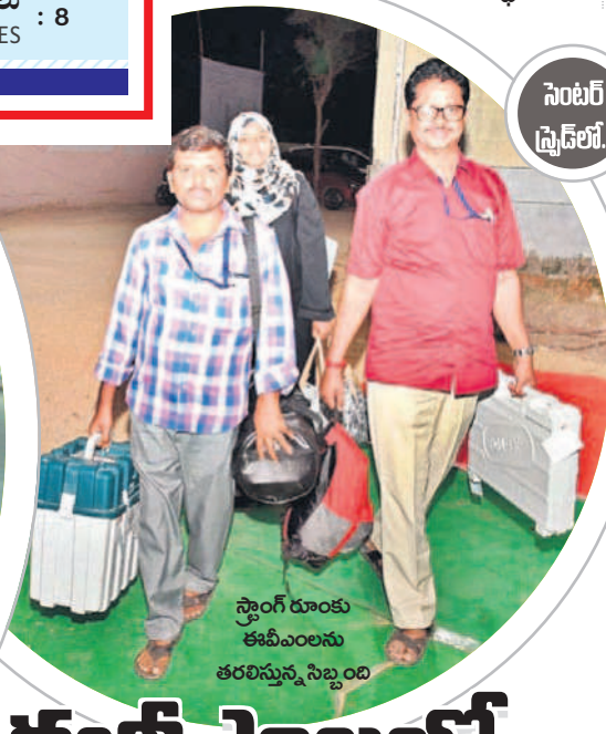
సెంటర్ స్ట్రెన్ లో..