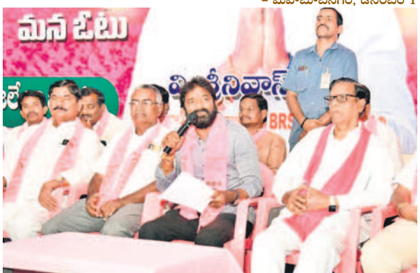
మహబూబ్ నగర్ లో మీడియాతో మాట్లాడుతున్న మంత్రి శ్రీనివాస్ గౌడ్