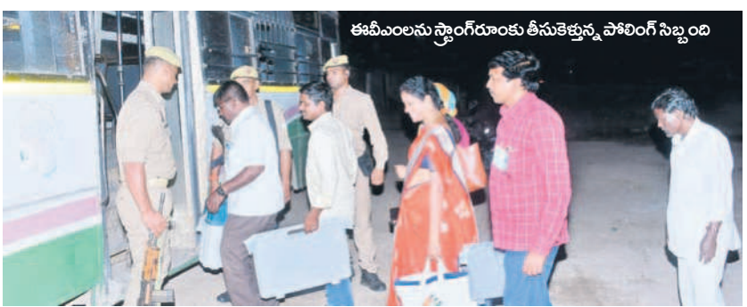
ఈవీఎలను స్టాండ్ రూంకు తీసుకెళ్తున్న పోలింగ్ సిబ్బంది

అలంపూర్, డిసెంబర్ 1 : కొంతకాలంగా నెలకొన్న ఉత్కంఠకు రేపటితో తెరపడనున్నది. ఆయా పార్టీల అభ్యర్థుల భవితవ్యం ఆదివారం బయటపడనున్నది. గురువారం నిర్వహించిన పోలింగ్ అనంతరం బ్యాలెట్ బాక్సులు, ఈవీఎలను అలంపూర్ వ్యవసాయ మార్కెట్ టాయర్లలోని స్టాండ్ రూం నుంచి జిల్లా కేంద్రానికి తరలించి భద్రపర్చారు. కాగా ఓట్ల లెక్కింపునకు అధికారులు ఏర్పాట్లు సిద్ధం చేశారు. నోటిఫికేషన్ వెలువడిన పుటి నుంచి అభ్యర్థుల కేటాయింపు మొదలు నామినేషన్ల దాఖలు, పోలింగ్ తోపాటు లెక్కింపు వరకు అదే