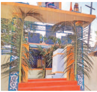
గట్టులోని అంబాభవాని ఆలయం