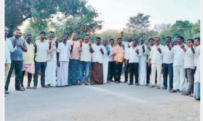
బున్యాదిపురంలో ఓటిసిన తర్వాత సిరా చూపుతున్న గ్రామస్థులు

ఓటు కోసం తిరిగొచ్చారు. ప్రతి గ్రామం నుంచి ఉపాధి నిమిత్తం వలస వెళ్లిన వారున్నారు. ముఖ్యంగా హైదరాబాద్ నగరంలోనే ఎక్కువమంది ఉపాధి పొందుతుండగా.. కొంత మంది ఒక రోజు ముందుగా గ్రామాలకు చేరుకోగా, మరికొందరు పోలింగ్ రోజే వచ్చారు. దీంతో అన్ని గ్రామాల్లో సందడి వాతావరణం కనిపించింది. మండలంలో ఐదువేల మంది ఓటర్లు ఓటు కోసం పట్టణాల నుంచి వచ్చి ఉంటారని అంచనా. ఓటు ఒక బాధ్యతగా వారు వ్యయప్రయోజనం కోర్చి వచ్చి ఓటిసే వెళ్లారు.