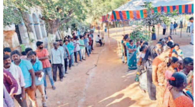
అత్తూకూరులో ఓటు వేసేందుకు బారులుదీరిన ఓటర్లు

అత్తూకూరు, డిసెంబర్ 1: 2023 అసెంబ్లీ ఎన్నికల పోలింగ్ ముగిసింది. మండలం వ్యాప్తంగా ఎలాంటి అవాంఛనీయ ఘటనలు చోటుచేసుకోకుండా ప్రశాంతంగా పోలింగ్ ముగిసింది. మండలం వ్యాప్తంగా 30,563 ఓట్లు ఉండగా 79.04 శాతం ఓటింగ్ నమోదైంది. గత ఎన్నికల్లో 81.56 శాతం నమోదుకాగా ఈ ఏడాది ఓటింగ్ 2 శాతం తగ్గింది. ఇదిలా ఉండగా ఏ గ్రామంలో ఎన్ని ఓట్లు పడ్డాయని పరిశీలిస్తే మూలమల్ల 1932 ఓట్లకు గానూ 1577 పోలింగ్ కాగా 81.62 శాతం నమోదైంది. జూరాలలో 1906కు గానూ 1595 ఓట్లు పోలింగ్ కాగా 83.06 శాతం నమోదైంది. గుంటిపల్లిలో