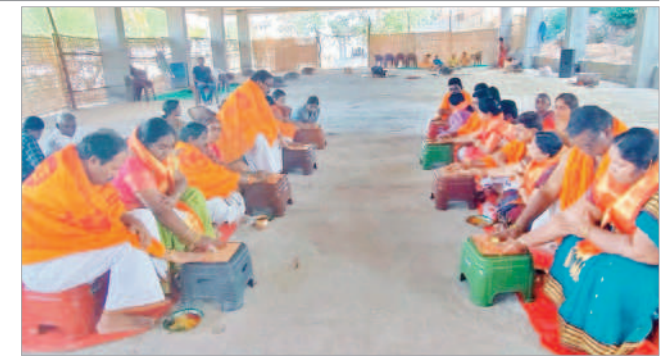
దత్త కోటిలింగేశ్వర ఆలయంలో రుద్రహోమం నిర్వహిస్తున్న భక్తులు