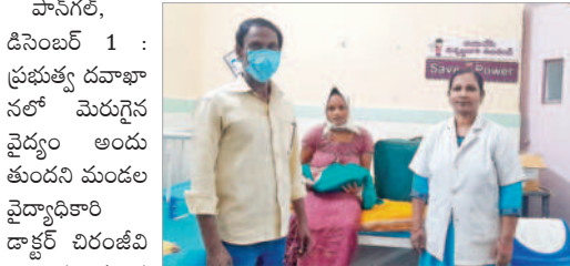
మహిళకు కేసీఆర్ కిట్ను అందజేస్తున్న వైద్య సిబ్బంది