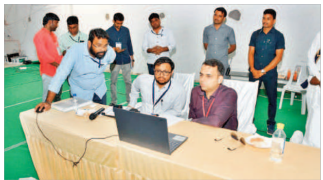
ఏఎంసీ గోదాంలో రెండో ర్యాండమైజేషన్ ను ఆన్ లైన్ ద్వారా పూర్తి చేస్తున్న ఎన్నికల అధికారి, సాధారణ పరిశీలకులు