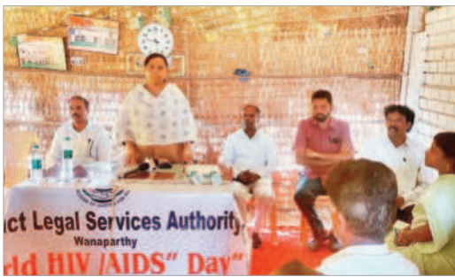
అవగాహన సదస్సులో మాట్లాడుతున్న సీనియర్ సివిల్ కోర్టు జడ్జి రజని