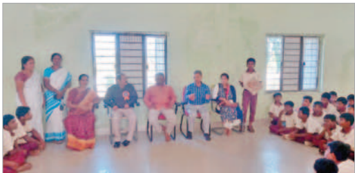
మదనాపురం గురుకుల పాఠశాలలో విద్యార్థులకు ఎయిడ్స్ పై అవగాహన కల్పిస్తున్న అధికారులు