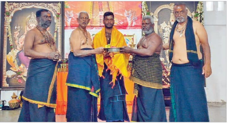
అన్నదాన ప్రభును సన్నానిస్తున్న గురుస్వాములు