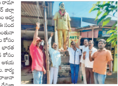
నివాళులర్పిస్తున్న గిరిజన సేవా సంఘం నాయకులు