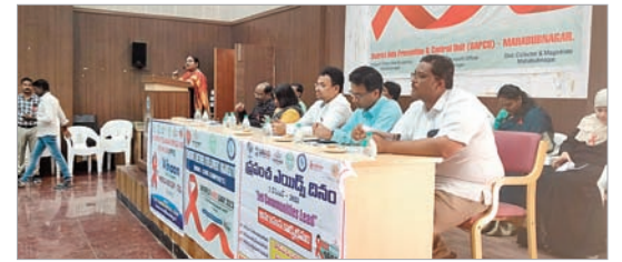
సమావేశంలో మట్లూరుకున్న గిరిజామంగతాయారు