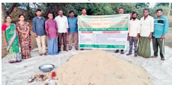
ధాన్యం కొనుగోలు కేంద్రాన్ని ప్రారంభిస్తున్న ఐకేపీ సిబ్బంది, రైతులు