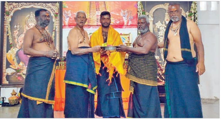
అన్నదాన ప్రభును సన్మానిస్తున్న గురుస్వాములు