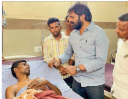
బాధితుడిని పరామర్శిస్తున్న మంత్రి శ్రీనివాస్ గౌడ్