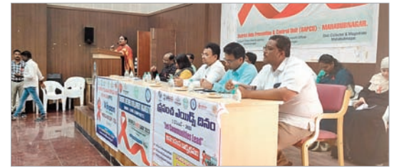
సమావేశంలో మట్లూడుతున్న గిరిజామంగతాయారు