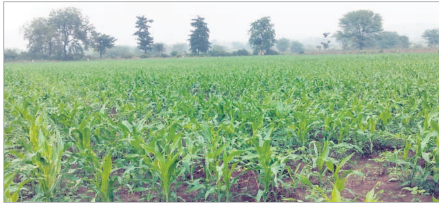
యాసంగిలో సాగు చేసిన మొక్కజొన్న

రైతాంగం 'ప్రత్యామ్నాయ సాగు'పై దృష్టి పెట్టింది. ఏటా ఒకేరకమైన పంటలు వేయడం వల్ల భూములు సారవంతం కోల్పోయి రైతులు నష్టపోయే ప్రమాదముండగా, మార్పిడిని ప్రోత్సహిస్తున్నది. రాష్ట్రంలో ప్రధానంగా వడ్లకు బదులు.. శనగ, గోధుమ, పొద్దు తిరుగుడు, ఆముదం, పెసర, మినుము, కుసుమ, ఆవాలు, పల్లి, జొన్నలు, ఉలువలు సాగుచేస్తూ లాభాలు గడిస్తున్నది. కాగా, కుభీర్ మండలంలో ఈ యాసంగిలో శనగ, మక్క పెద్ద మొత్తంగా సాగుచేస్తున్నది. - కుభీర్, డిసెంబర్ 1