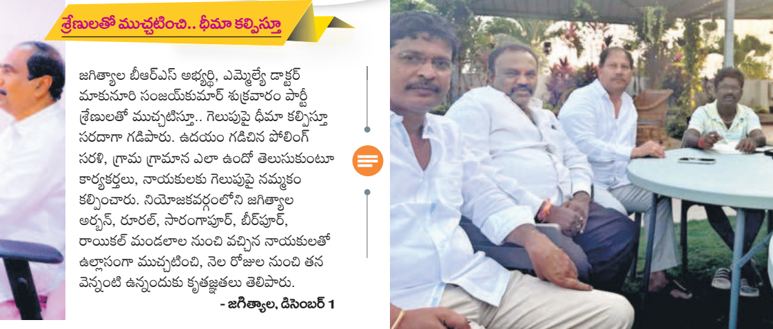
జగిత్యాల, డిసెంబర్ 1