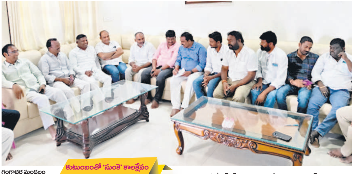
కుటుంబంతో 'సుంకె' కాలక్షేపం గంగాధర మండలం బూరుగుపల్లిలో బీఆర్ఎస్ ప్రజాప్రతినిధులతో మాట్లాడుతున్న ఎమ్మెల్యే సుంకె రవిశంకర్ చొప్పుడం బీఆర్ఎస్ అభ్యర్థి, ఎమ్మెల్యే సుంకె రవిశంకర్ శుక్రవారం తన కుటుంబ సభ్యులతో కాలక్షేపం చేస్తూ గడిపారు. తన నివాసానికి వచ్చిన ప్రజాప్రతినిధులు, నాయకులతో ఎన్నికలపై విశ్లేషణ చేశారు. కుటుంబ సభ్యులతో మనస్తూర్తిగా మాట్లాడుకోడానికి అవకాశం దొరికిందని ఎమ్మెల్యే తెలిపారు. నియోజకవర్గంలో గులాబీ జెండా మరోసారి ఎగరడం ఖాయమని ధీమా వ్యక్తం చేశారు. - గంగాధర, డిసెంబర్ 1