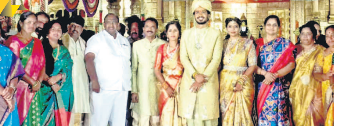
చున్నాబాద్, డిసెంబర్ 1