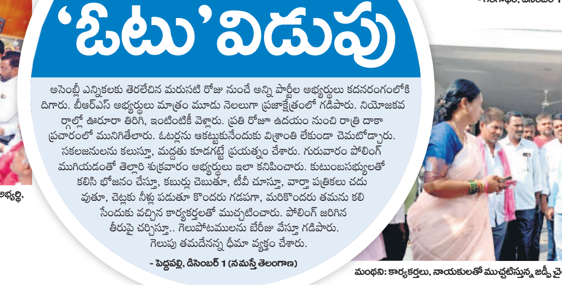
మంధన: కార్యకర్తలు, నాయకులతో ముచ్చటిస్తున్న జడ్పీ చైర్మన్ పుట్ల మధూకర్