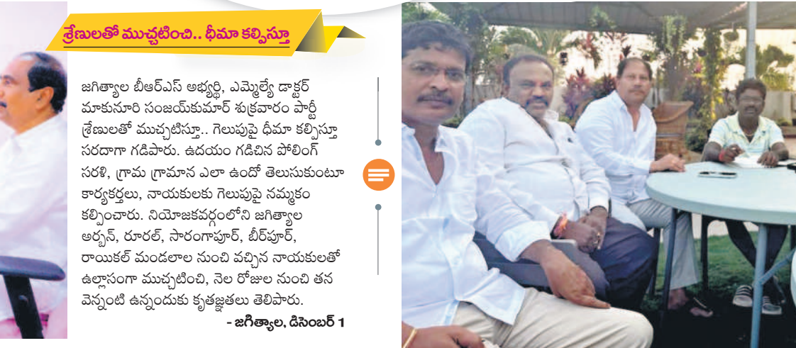
మంధని: కార్యకర్తలు, నాయకులతో ముచ్చటిస్తున్న జడ్పీ చైర్మన్ పుట్ల మధుకర్