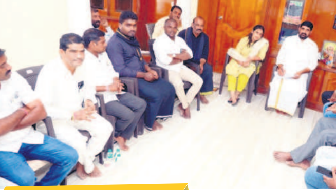
ఓటింగ్ సరళిపై ఆరా తీస్తూ