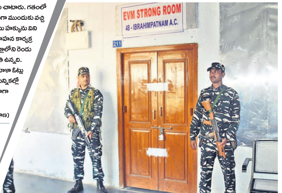
ఇబ్రహీంపట్నంలోని స్టాంక్ రూం వద్ద పోలీసుల బందోబస్తు

అభ్యర్థుల భవిష్యత్తు ఈవీఎంలలో నిక్షిప్తమైంది. పోలింగ్ ముగియగానే ఎన్నికల ఏజెంట్లు, అధికారుల సమక్షంలో బ్యాలెట్ బాక్సులకు సీలు చేశారు. వాటిని కేటాయించిన లెక్కింపు కేంద్రాలకు రాత్రికి రాత్రే తరలించి స్టాంక్ రూముల్లో భద్రపరిచారు. ప్రతి స్టాంక్ రూం వద్ద సాయుధ పోలీసు బలగాలతో భద్రతా చర్యలు చేపట్టారు.