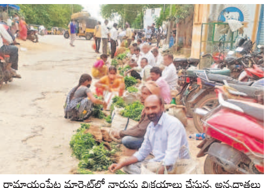
రామాయంపేట మార్కెట్లో నారును విక్రయాలు చేస్తున్న అన్నదాతలు