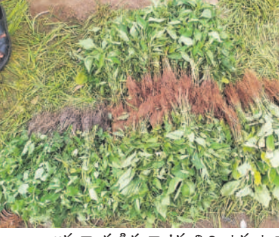
అమ్ముకాలకు సిద్ధంగా ఉన్న మిర్చి, టమాటా నారు