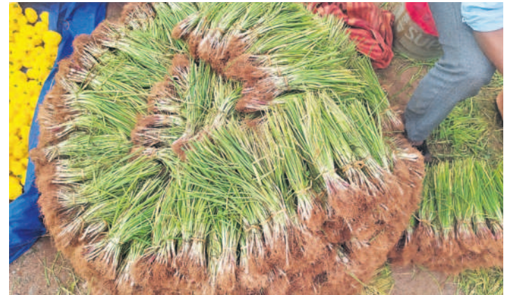
విక్రయాలకు సిద్ధంగా ఉన్న ఉల్లినారు

రామాయంపేట, డిసెంబర్ 1: నారు అమ్ముకాలతో రైతులను లాభాలు గడిస్తున్నాయి. ఈ అంగళ్లలో తాము సుమారు రూ.30వేల వరకు అమ్ముకాలు చేస్తున్నట్లు రైతులు చెబుతున్నారు. ఉల్లినారు అమ్ముకాలతో తమ ఖర్చులు పోననే తమకు రూ.20వేల వరకు సంపాదిస్తామని సూర్యాపేట, నల్లగొండకు చెందిన రైతులు చెబుతున్నారు. తాము ఇతర పంటల జోలికి వెళ్లమని, కేవలం కూరగాయల పంటలు వేసుకుని విక్రయాలు జరుపుతామని వారు చెబుతున్నారు. తమకున్న వ్యవసాయంలో మొత్తం ఆరుతడి పంటలే వేస్తామన్నారు.