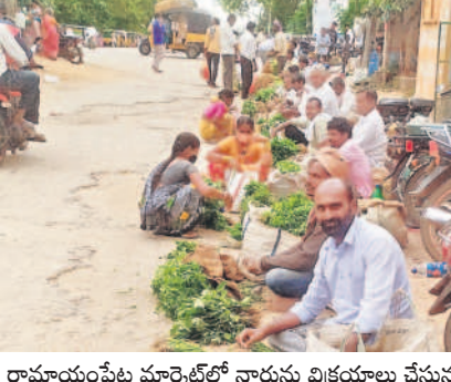
రామాయంపేట మార్కెట్లో నారును విక్రయాలు చేస్తున్న అన్నదాతలు

ఆరుతడి పంటలతోనే లాభం గత ఏడాది నుంచి నా భూమిలో ఆరుతడి పంటలు సాగు చేస్తున్నా. మంచి లాభాలు వస్తున్నాయి. రామాయంపేట అంగడికి వస్తే మా నారును హైదరాబాద్, విజామాబాద్ కు వెళ్లి రైతులు, ప్రయాణికులు బాగా తీసుకుంటారు. ఇక్కడైనంత గిరాకీ ఎక్కువ కాదు. నాలుగు సంతుల్లో నాను తెస్తే రెండు గంటల్లోనే అమ్ముకుంటా.