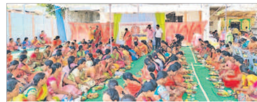
కన్యకాపరమేశ్వరీ ఆలయంలో సామూహిక కుంకుమార్చన