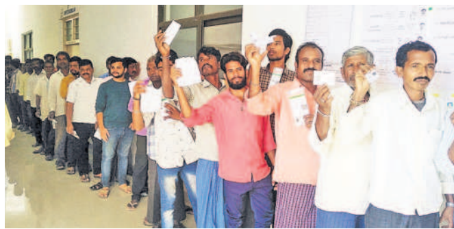
దుబ్బాకలోని పోలింగ్ కేంద్రం వద్ద బారులు తీరిన ఓటర్లు (ఫైల్)