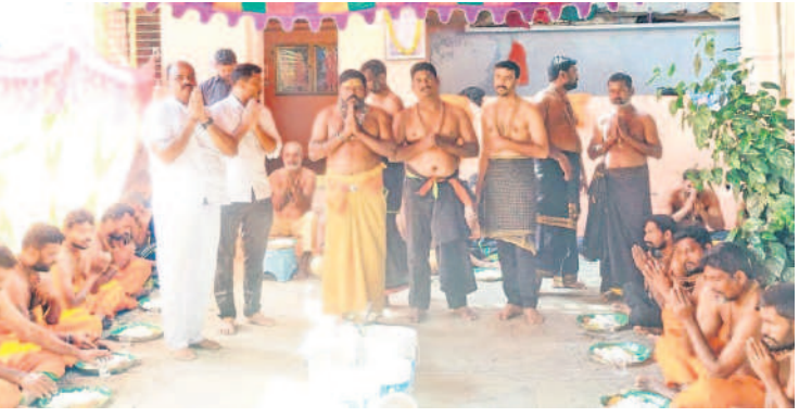
అన్నప్రసాదాన్ని స్వీకరిస్తున్న మాలధారులు