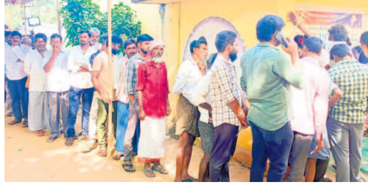
నిడమనూరు: గుంటిపల్లిలో ఓటేసేందుకు బారులు దీరిన ఓటర్లు (ఫైల్)

● 2018 కంటే 0.86 శాతం తగ్గిన ఓటింగ్ హాలియా, డిసెంబర్ 1: నాగార్జున సాగర్ నియోజకవర్గంలో 85.79 శాతం పోలింగ్ నమోదైంది. నియోజకవర్గంలో 2, 33, 412 మంది ఓటర్లు ఉన్నారు. ఎన్నికల కమిషన్ 234 ప్రాంతాల్లో