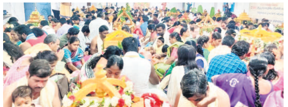
సామూహిక సత్యనారాయణస్వామి వ్రతాలు ఆచరిస్తున్న భక్తులు

కార్తీక బహుళ పంచమి సందర్భంగా మంచినారాయణ జిల్లా దండేపల్లి మండలంలోని గూడెం సత్యనారాయణ స్వామి ఆలయం భక్తులతో సందడిగా కనిపించింది. శనివారం ఉదయం ఆయా ప్రాంతాల నుంచి తరలివచ్చిన ప్రజలు పవిత్ర గోదావరిలో పుణ్యస్నానాలు ఆచరించారు. కార్తీక దీపాలు వదిలి.. గంగమ్మ తల్లికి మొక్కులు తీర్చుకున్నారు. అనంతరం గుట్ట కింది భాగంలో రావి చెట్టు వద్ద, గుట్టపైన ధ్వజస్తంభం వద్ద మహిళలు ప్రత్యేక పూజలు చేశారు. అనంతరం స్వామి వారిని దర్శించుకొని తీర్థ ప్రసాదాలు స్వీకరించారు. 465 మంది సామూహిక సత్యనారాయణస్వామి వ్రతాలు ఆచరించారు. అనంతరం అభిషేకాలు, అర్చనలు చేశారు. - దండేపల్లి, డిసెంబర్ 2