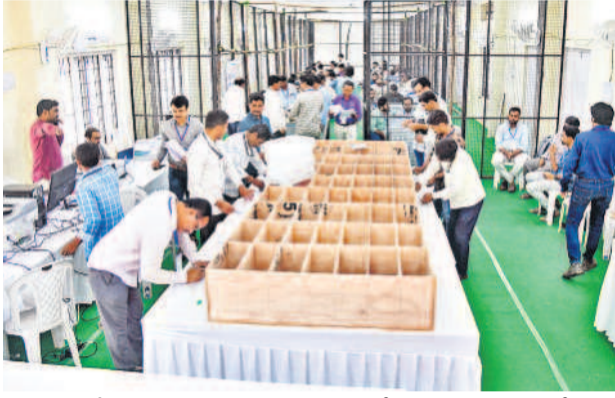
సిద్దిపేట ఇందూర్ ఇంజనీరింగ్ కళాశాలలోని కొంటింగ్ సెంటర్ లో టేబుల్ గేమ్స్ పాఠశాలను ఏర్పాటు చేస్తున్న అధికారులు, సిబ్బంది