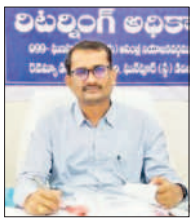
మాట్లాడుతున్న వాసం రామ్మూర్తి

స్టేషన్ ఘనపూర్, డిసెంబర్ 2 : గురువారం జరిగిన అసెంబ్లీ ఎన్నికల ఓట్ల లెక్కింపును ఏర్పాటు పూర్తి చేసినట్లు ఎన్నికల రిటర్నింగ్ అధికారి, ఆర్డీవో వాసం రామ్మూర్తి శనివారం ఒక ప్రకటనలో తెలిపారు. జనగామ జిల్లాలోని పెం బర్తిలో గల విద్యార్థి భారతి ఇన్స్టిట్యూట్ ఆఫ్ టెక్నాలజీ కళాశాలలో ఆదివారం 8 గంటల నుంచి ఓట్ల లెక్కింపు ప్రక్రియ ప్రారంభమవుతుంది, ఇందుకు అన్ని ఏర్పాట్లు చేసినట్లు ఆయన తెలిపారు. నియోజకవర్గంలో మొత్తం ఓటర్లు 2,49,155 మంది ఉండగా 290 పోలింగ్ బూతులలో ఓటింగ్ నిర్వహించినట్లు తెలిపారు. 12,18,484 ఓట్ల పోలయ్యాయని, ఈ ఓట్ల లెక్కింపులో 150 సిబ్బందితో 14 టీబీఎస్, 21 రౌండ్లలో లెక్కింపు ప్రక్రియ జరుగుతుందని ఆయన తెలిపారు.