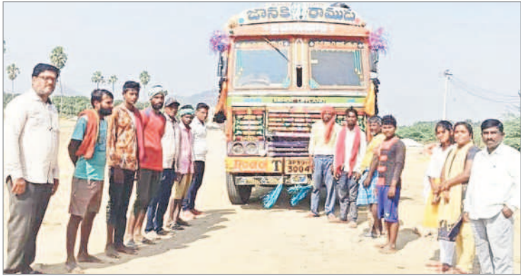
జగిత్యాల రూరల్: కొనుగోలు కేంద్రం నుంచి లాటిలో ధాన్యాన్ని తరలిస్తున్న అధికారులు

జగిత్యాల రూరల్, డిసెంబర్ 2: మండలంలోని ఐకేపీ కొనుగోలు కేంద్రాల్లో ధాన్యం కొనుగోళ్లు వేగవంతం చేసినట్లు ఏపీఎం గంగాధర్ తెలిపారు. శనివారం మండలంలోని పొలస, వెల్దుర్తి, నర్సింకపూర్, అంతర్గాం, కల్లెడ, జాబితాపూర్, ధర్మాచర్ల, మోతే గ్రామాలను ఆయన సందర్శించారు. అంతర్గాం, వంజరిపల్లి గ్రామాల్లో ధాన్యం కొనుగోళ్లు ముగిసినట్లు వెల్లడించారు. మిగతా కేంద్రాల్లో కూడా త్వరితగతిన పూర్తి చేసేందుకు కృషి చేస్తున్నట్లు పేర్కొన్నారు. రూరల్ మండలంలో 17 కొనుగోలు కేంద్రాల్లో 69, 555 క్వింటాళ్లు, అర్బన్ మండలంలోని ఐదు కేంద్రాల్లో 15,570 క్వింటాళ్ల ధాన్యం కొనుగోలు చేసినట్లు వెల్లడించారు. ఆయా కార్యక్రమాల్లో సీసీలు