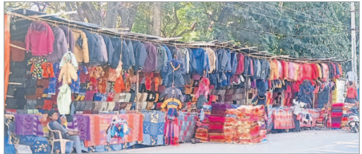
మెట్పల్లి పట్టణ శివారులో నేపాల్ లు ఏర్పాటు చేసుకున్న తాత్కాలిక ఉన్ని దుస్తుల విక్రయ కేంద్రాలు