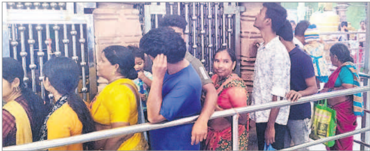
ధర్మపురి: సరసింహస్వామి దర్శనం కోసం క్యూలో నిల్చున్న భక్తులు

ధర్మపురి, డిసెంబర్ 2: ధర్మపురి లక్ష్మీనరసింహస్వామి సన్నిధిలో శనివారం భక్తుల రద్దీ ఎక్కువైంది. కార్తీక మాసం సందర్భంగా వివిధ ప్రాంతాల నుంచి క్షేత్రానికి చేరుకున్న భక్తులు మొదట గోదావరిలో పుణ్యస్నానాలాచరించారు. అనంతరం లక్ష్మీనరసింహస్వామివారితో పాటు అనుబంధ ఆలయాల్లో స్వామివార్లను దర్శించుకొని మొక్కులు చెల్లించుకున్నారు. ఆలయ ప్రాంగణంలో గల ఉసిరి చెట్టు వద్ద దీపాలను వెలిగించారు. కార్తీక మాసం సందర్భంగా బ్రాహ్మణులకు దీపదానాలు చేశారు.