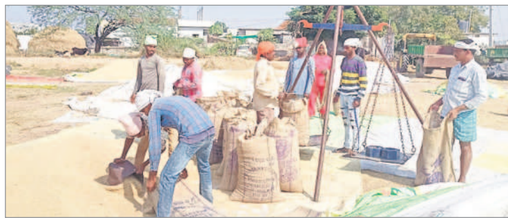
పెగడపల్లి: మద్దులపల్లి కొనుగోలు కేంద్రంలో వరి ధాన్యం తూకం వేస్తున్న హమాల్ లు