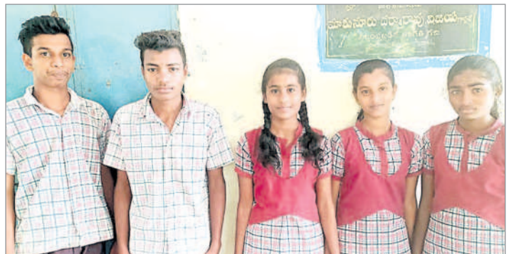
ఉమ్మడి జిల్లా బాస్కెట్ బాల్ పోటీలకు ఎంపికైన అంతర్గాం విద్యార్థులు