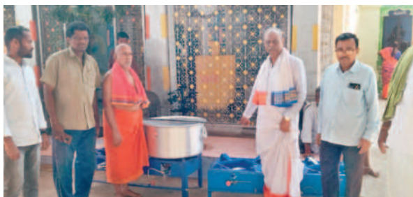
ఆలయానికి వంట సామగ్రిని వితరణ చేస్తున్న భక్తులు