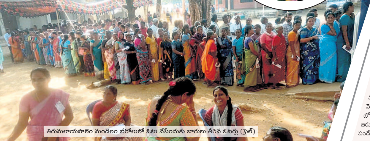
తిరుమలాయపాలెం మండలం బోర్డులో ఓటు వేసేందుకు బారులు తీరిన ఓటర్లు (ఫైల్)