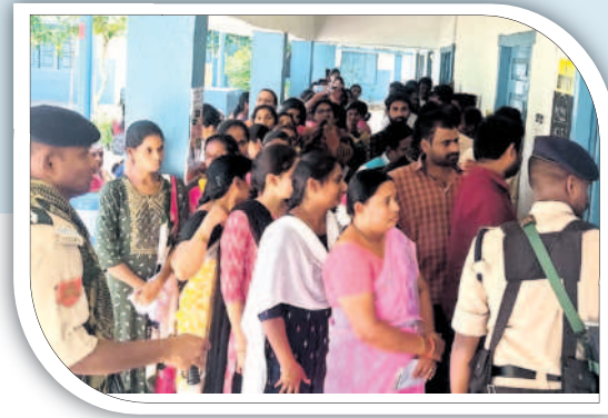
మల్లేపల్లిలో ఓటు వేసేందుకు లైన్లో నించున్న ఓటర్లు (ఫైల్)