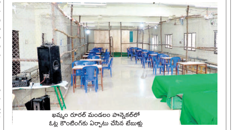
ఖమ్మం రూరల్ మండలం పాన్వెక్టర్లో ఓట్ల కొంటింగ్కు ఏర్పాటు చేసిన టేబుల్లు

ఖమ్మం జిల్లాలో లెక్కింపు ఇలా.. ఖమ్మం జిల్లా పరిధిలోని ఖమ్మం నియోజకవర్గ పరిధిలో మొత్తం ఓట్ల 3,22,996 ఉండగా 2,90,724 ఓట్లు పోలయ్యాయి. ఇక్కడ 355 పోలింగ్ బాంట్లకు ఉండగా 25 రౌండ్లలో ఓట్ల లెక్కింపు జరగనున్నది. పాలేరు నియోజకవర్గంలో మొత్తం ఓట్ల 2,96,287 ఉండగా 2,14,810 ఓట్లు పోలయ్యాయి. 289 పోలింగ్ బాంట్లకు ఉండగా 20 రౌండ్లలో ఓట్ల లెక్కింపు జరగనుంది. మధిర నియోజకవర్గంలో మొత్తం 2,21,326 ఓట్లకు ఉండగా 1,94,615 ఓట్లు పోలయ్యాయి. 286 పోలింగ్ బాంట్లకు ఉండగా 19 రౌండ్లలో ఓట్ల లెక్కింపు జరగనున్నది. వైరా నియోజకవర్గంలో 1,99,069 ఓట్లకు ఉండగా 1,67,989 ఓట్లు పోలయ్యాయి. 252 పోలింగ్ బాంట్లకు ఉండగా 18 రౌండ్లలో ఓట్ల లెక్కింపు జరగనున్నది. సత్తుల నియోజ