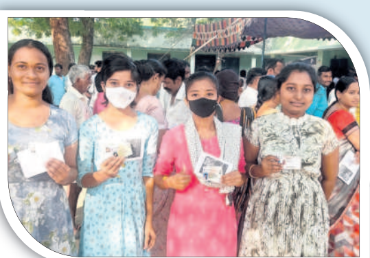
నాయకనగరాడంలో ఓటు వేసిన యవత (ఫైల్)