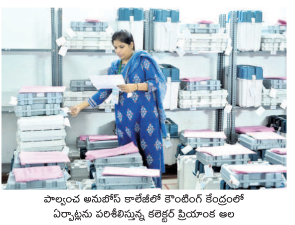
పాలేరు అనుబంధం కాలెజీలో కొంటింగ్ కేంద్రంలో ఏర్పాటు పరిశీలకుల కలెక్టర్ ప్రయాణం ఆల

భద్రాచలం జిల్లాలో లెక్కింపు ఇలా.. భద్రాచలం జిల్లా పరిధిలోని కొత్తగూడెం నియోజకవర్గంలో 2,43,846 ఓట్లకు ఉండగా 1,86,347 ఓట్లు పోలయ్యాయి. 253 పోలింగ్ బాంట్లకు 18 రౌండ్లలో లెక్కింపు ఉంటుంది. పినపాక నియోజకవర్గంలో 1,98,402 ఓట్లకు ఉండగా 1,58,978 ఓట్లు పోలయ్యాయి. 244 పోలింగ్ బాంట్లకు 17 రౌండ్లలో లెక్కింపు ఉంటుంది. ఇల్లెందు నియోజకవర్గంలో 2,19,569 ఓట్లకు ఉండగా 1,76,840 ఓట్లు పోలయ్యాయి. 241 పోలింగ్ బాంట్లకు 17 రౌండ్లలో ఓట్ల లెక్కింపు ఉంటుంది. అన్నారావుపేట నియోజకవర్గంలో 1,55,961 ఓట్లకు ఉండగా 1,35,501 ఓట్లు పోలయ్యాయి. 184 పోలింగ్ బాంట్లకు 13 రౌండ్లలో ఓట్ల లెక్కింపు ఉంటుంది. భద్రాచలం నియోజకవర్గంలో 1,48,661 ఓట్లకు ఉండగా 1,17,447 ఓట్లు పోలయ్యాయి. 176 పోలింగ్ బాంట్లకు 12 రౌండ్లలో ఓట్ల లెక్కింపు ఉంటుంది. భద్రాచలం జిల్లాలో 9,66,439 ఓట్లకు ఉండగా 7,75,113 ఓట్లు పోలయ్యాయి. 1,098 పోలింగ్ బాంట్లకు 77 రౌండ్లలో ఓట్ల లెక్కింపు ఉంటుంది.