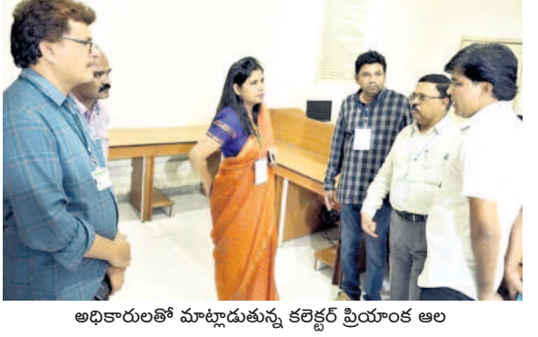
అధికారులతో మాట్లాడుతున్న కలెక్టర్ ప్రయాణం ఆల

భద్రాచలం జిల్లాలో లెక్కింపు ఇలా.. భద్రాచలం జిల్లా పరిధిలోని కొత్తగూడెం నియోజకవర్గంలో 2,43,846 ఓట్లకు ఉండగా 1,86,347 ఓట్లు పోలయ్యాయి. 253 పోలింగ్ బాంట్లకు 18 రౌండ్లలో లెక్కింపు ఉంటుంది. పినపాక నియోజకవర్గంలో 1,98,402 ఓట్లకు ఉండగా 1,58,978 ఓట్లు పోలయ్యాయి. 244 పోలింగ్ బాంట్లకు 17 రౌండ్లలో లెక్కింపు ఉంటుంది. ఇల్లెందు నియోజకవర్గంలో 2,19,569 ఓట్లకు ఉండగా 1,76,840 ఓట్లు పోలయ్యాయి. 241 పోలింగ్ బాంట్లకు 17 రౌండ్లలో ఓట్ల లెక్కింపు ఉంటుంది. అన్నారావుపేట నియోజకవర్గంలో 1,55,961 ఓట్లకు ఉండగా 1,35,501 ఓట్లు పోలయ్యాయి. 184 పోలింగ్ బాంట్లకు 13 రౌండ్లలో ఓట్ల లెక్కింపు ఉంటుంది. భద్రాచలం నియోజకవర్గంలో 1,48,661 ఓట్లకు ఉండగా 1,17,447 ఓట్లు పోలయ్యాయి. 176 పోలింగ్ బాంట్లకు 12 రౌండ్లలో ఓట్ల లెక్కింపు ఉంటుంది. భద్రాచలం జిల్లాలో 9,66,439 ఓట్లకు ఉండగా 7,75,113 ఓట్లు పోలయ్యాయి. 1,098 పోలింగ్ బాంట్లకు 77 రౌండ్లలో ఓట్ల లెక్కింపు ఉంటుంది.