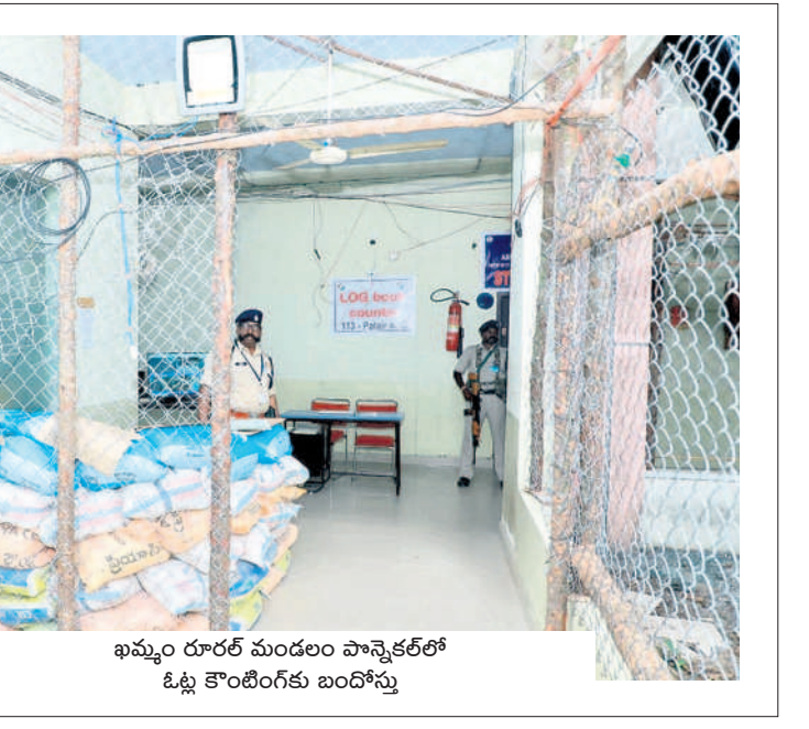
ఖమ్మం రూరల్ మండలం పాన్వెక్టర్లో ఓట్ల కొంటింగ్కు బండ్లిస్తు