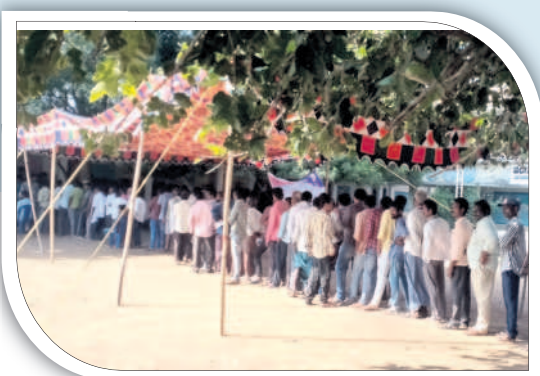
ఖమ్మం రూరల్లో ఓటు వేసేందుకు బారులు తీరిన ఓటర్లు (ఫైల్)