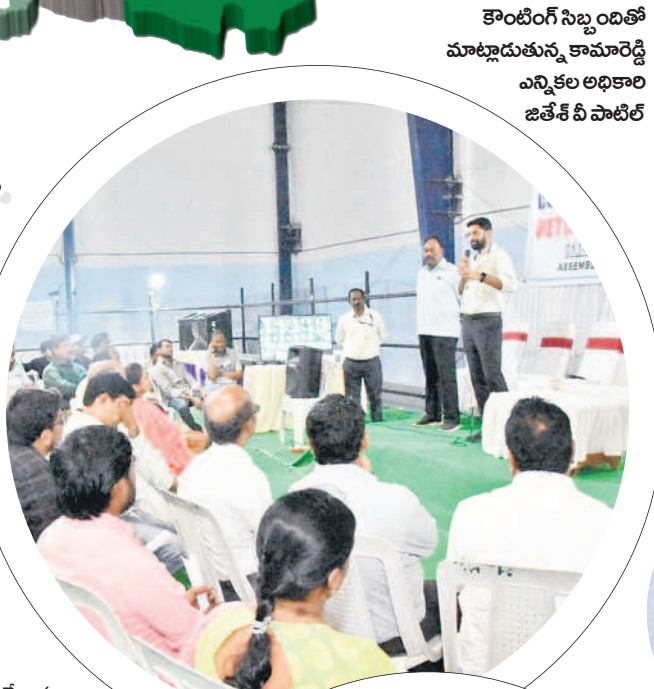
కౌంటింగ్ సిబ్బందితో మాట్లాడుతున్న కామారెడ్డి ఎన్నికల అధికారి జితేష్ వీ పాటిల్

కౌంటింగ్ కేంద్రాల పరిశీలన కొనసాగించారు. కలెక్టర్ జితేష్ వీ పాటిల్, ఎస్సీ సెంటా శర్మ పరిశీలించి పోలీసు, కౌంటింగ్ సిబ్బందికి పలు సూచనలు చేశారు. ప్రతి నియోజకవర్గానికి ఓట్ల లెక్కింపు కోసం 14 టీబిబ్ల్యూ చొప్పున ఏర్పాటు చేస్తున్న 18 నుంచి 20 రౌండ్ల వారీగా నిర్వహించే పక్కడపి చర్యలు తీసుకున్నామని అన్నారు. పోస్టల్ బ్యాలెట్