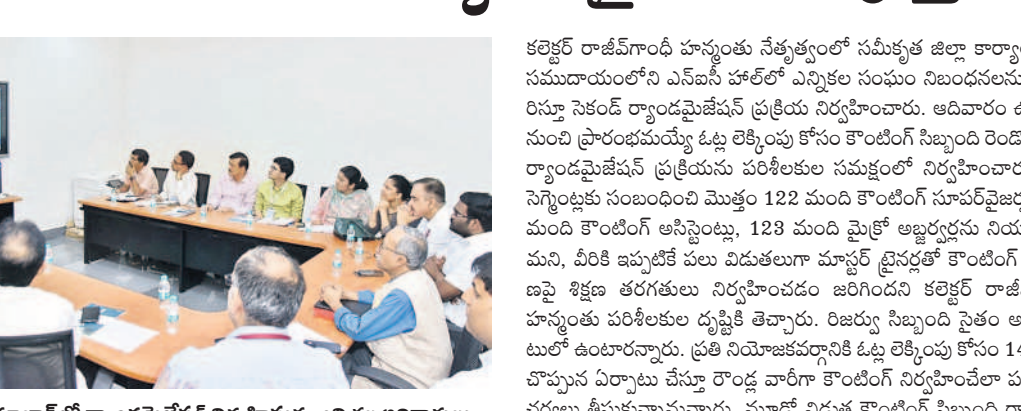
నిజామాబాద్ లో ర్యాండ్ మైజేషన్ నిర్వహిస్తున్న ఎన్నికల అధికారులు

జులై వాడి, డిసెంబర్ 2: శాసనసభ ఎన్నికల ఓట్ల లెక్కింపు ఏర్పాట్లలో భాగంగా కౌంటింగ్ సిబ్బంది రెండో విడత ర్యాండ్ మైజేషన్ ప్రక్రియను శనివారం ఎన్నికల పరిశీలకుల సమక్షంలో పూర్తిచేశారు. జిల్లా ఎన్నికల అధికారి,