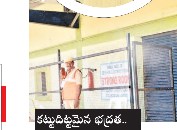
నిజామాబాద్ స్టాండ్ రూమ్ వద్ద పోలీసు బందోబస్తు