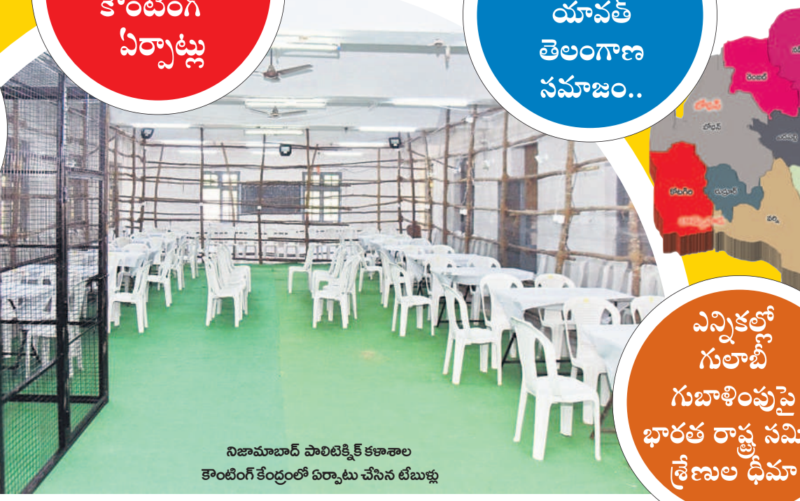
నిజామాబాద్ పాలిటెక్నిక్ కళాశాల కౌంటింగ్ కేంద్రంలో ఏర్పాటు చేసిన టీబిబ్ల్యూ

ఉత్తరంగా ఎదురు చూస్తోన్న యావత్ తెలంగాణ సమాజం..