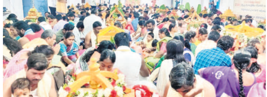
సామూహిక సత్యనారాయణస్వామి వ్రతాలు ఆచరిస్తున్న భక్తులు

కార్తీక బహుళ పంచమి సందర్భంగా మంచెర్యాల జిల్లా దండేపల్లి మండలంలోని గూడెం సత్యనారాయణ స్వామి ఆలయం భక్తులతో సందడిగా కనిపించింది. శనివారం ఉదయం ఆయా ప్రాంతాల నుంచి తరలివచ్చిన ప్రజలు పవిత్ర గోదావరిలో పుణ్యస్నానాలు ఆచరించారు. కార్తీక దీపాలు వదిలి.. గంగమ్మ తల్లికి మొక్కులు తీర్చుకున్నారు. అనంతరం గుట్ట కింది భాగంలో రావి చెట్టు వద్ద, గుట్టపైన ధ్వజస్తంభం వద్ద మహిళలు ప్రత్యేక పూజలు చేశారు. అనంతరం స్వామి వారిని దర్శించుకొని తీర్థ ప్రసాదాలు స్వీకరించారు. 465 మంది సామూహిక సత్యనారాయణస్వామి వ్రతాలు ఆచరించారు. అనంతరం అభిషేకాలు, అర్చనలు చేశారు. - దండేపల్లి, డిసెంబర్ 2