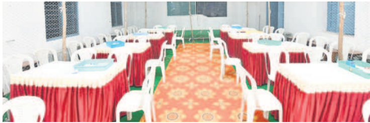
కౌంటింగ్ కోసం ఏర్పాటు చేసిన టేబుళ్లు