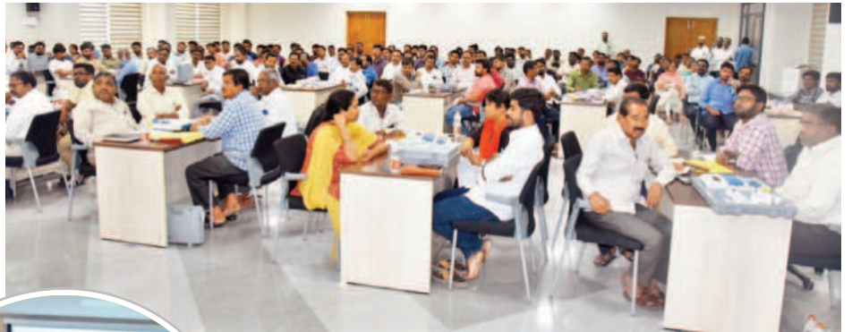
సమావేశానికి హాజరైన అధికారులు

గద్వాల, డిసెంబర్ 2 : ఎన్నికల కౌంటింగ్ నిర్వహణలో పాఠశాలకు తావివోయ్యి కుండా మైక్రోఅబ్జర్వర్లు, తాసీల్దార్లు, కౌంటింగ్ సూపర్వైజర్లు అప్రమత్తంగా ఉండాలని ఎన్నికల అధికారి, కలెక్టర్ వల్లూరు క్రాంతి ఆదేశించారు. శనివారం ఐడీవోసీ సమావేశ హాల్లో ఏర్పాటు చేసిన సమావేశంలో సమీక్ష నిర్వహించారు. కౌంటింగ్ ప్రక్రియలో ఎన్నికల నిబంధనల ప్రకారం వ్యవహరించాలని చెప్పారు. రిటర్నింగ్ అధికారుల ఆధ్వర్యంలో కౌంటింగ్ ప్రక్రియ టీంల వారిగా చేయాల్సి ఉంటుందన్నారు. ఆర్వోల వద్ద ఆర్డర్ కాపీ, ఐడీకార్డు తీసుకోవాలని ఆదేశించారు. కౌంటింగ్ రోజు ఉదయం 8గంటలకు పోస్టల్ బ్యాలెట్ లెక్కింపు మొదలుపెట్టుతుందని, అనంతరం ఉదయం 8:30గంటలకు కాపీమెంట్ కౌంటింగ్ ప్రారంభం చేయాలని