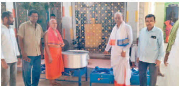
ఆలయానికి వంటసామగ్రి వితరణ చేస్తున్న భక్తులు