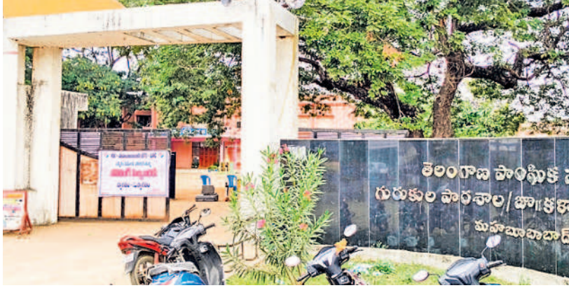
ఓట్ల లెక్చింగు జరగనున్న తెలంగాణ సాంఘిక సంక్షేమ గురుకుల పాఠశాల ఇదే..

మహబూబాబాద్, డిసెంబర్ 2 (సమస్త తెలంగాణ): అసెంబ్లీ ఎన్నికల ఫలితాలు నేడు వెలువడనున్నాయి. జిల్లాలోని మహబూబాబాద్, డోర్నకల్ నియోజకవర్గాలకు గత నెల 30న ఎన్నికలు జరుగగా, నేడు కౌంటింగ్ ప్రక్రియ చేపట్టనున్నారు. ఇందుకోసం అధికారులు అన్ని ఏర్పాట్లు చేశారు. పోలింగ్ పూర్తయిన తర్వాత అధికారులు ఈవీఎంలను మహబూబాబాద్ జిల్లా కేంద్రంలోని తెలంగాణ సాంఘిక సంక్షేమ గురుకుల పాఠశాల, జూనియర్ కళాశాల (బాలికలు)లో భద్రపరిచారు. స్టాంక్ రూమ్ వద్ద పటిష్ట బందోబస్టును ఏర్పాటు చేశారు. కాగా, నేడు ఓట్ల లెక్చింగు కోసం మహబూబాబాద్, డోర్నకల్ నియోజకవర్గాల ఓట్ల కౌంటింగ్ కోసం వేర్వేరుగా గడులను కేటాయించారు. ఉదయం 8 గంటలకు లెక్చింగు ప్రక్రియ ప్రారంభం కానున్నది. మహబూబాబాద్ నియోజకవర్గానికి మొత్తం 21 రౌండ్లు, డోర్నకల్ నియోజకవర్గానికి 19 రౌండ్లలో ఓట్ల లెక్చింగు జరగనుంది. రెండు రోజులుగా ఓట్ల లెక్చింగు కోసం జిల్లా అధికారులు పెద్ద ఎత్తున ఏర్పాట్లు చేశారు. ఇప్పటికే ఈవీఎంలను భద్రపరిచిన స్టాంక్ రూంల వద్ద భారీ బందోబస్టు ఏర్పాటు చేశారు. ఒక్కో నియోజకవర్గంలో ఓట్ల లెక్చింగు కోసం 14 టేబుళ్లు సమకూర్చారు. కౌంటింగ్ సిబ్బంది కూర్చునేందుకు వీలుగా గదిలోపల చైర్లు, టేబుళ్లు, ఫ్యాన్లు, లైట్లు తదితర సదుపాయాలు కల్పించారు. ఒక నియోజకవర్గంలో ఒక్కో పార్టీ నుంచి 14 మంది ఏజెంట్లు లోపలికి వెళ్లేందుకు అనుమతి ఇచ్చారు. వీరికి జిల్లా ఎన్నికల అధికారులు పాస్లు అందజేశారు. తెలంగాణ సాంఘిక సంక్షేమ గురుకుల పాఠశాల, జూనియర్ కళాశాల (బాలికలు) ప్రధాన