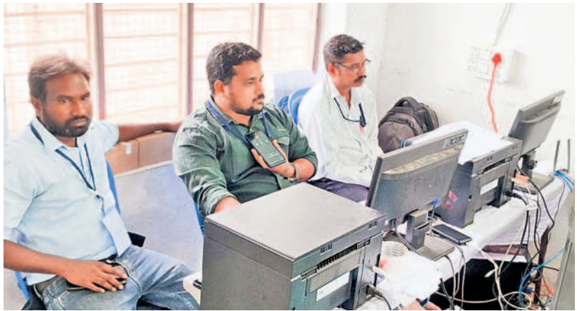
కౌంటింగ్ కేంద్రంలో సిబ్బంది