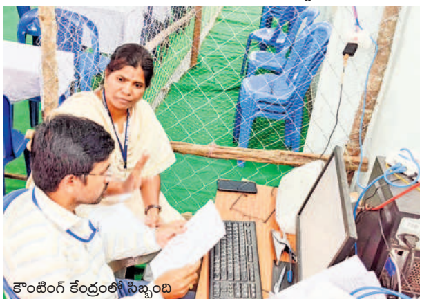
కౌంటింగ్ కేంద్రంలో సిబ్బంది