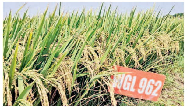
పండిన వరి పంట (వడ్లు)

మహబూబాబాద్ రూరల్, డిసెంబర్ 2 : ఇన్ని రోజులు ఎన్నికల ప్రచారంలో బిజీ బిజీగా గడిపిన మంత్రి సత్యవతి రాథోడ్ పోలింగ్ ముగియడంతో కాస్త రిలాక్స్ అయ్యారు. శనివారం మహబూబాబాద్ పట్టణంలో స్వయంగా ఆమె తన మనుమ రాళ్ల కోసం షాపింగ్ చేసి ఆట వస్తువులను కొనుగోలు చేశారు. తన ఇంట్లో వారితో కలిసి ఉల్లాసంగా గడిపారు.