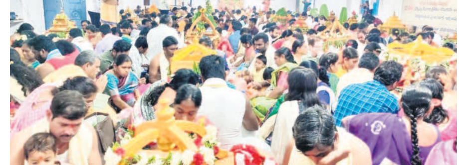
సామూహిక సత్యనారాయణస్వామి వ్రతాలు ఆచరిస్తున్న భక్తులు

కార్తీక బహుళ పంచమి సందర్భంగా మంచినారాయణ జిల్లా దండేపల్లి మండలంలోని గూడెం సత్యనారాయణ స్వామి ఆలయం భక్తులతో సందడిగా కనిపించింది. శనివారం ఉదయం ఆయా ప్రాంతాల నుంచి తరలివచ్చిన ప్రజలు పవిత్ర గోదావరిలో పుణ్యస్నానాలు ఆచరించారు. కార్తీక దీపాలు వదిలి.. గంగమ్మ తల్లికి మొక్కులు తీర్చుకున్నారు. అనంతరం గుట్ట కింది భాగంలో రావి చెట్టు వద్ద, గుట్టపైన ధ్వజస్తంభం వద్ద మహిళలు ప్రత్యేక పూజలు చేశారు. అనంతరం స్వామి వారిని దర్శించుకొని తీర్థ ప్రసాదాలు స్వీకరించారు. 465 మంది సామూహిక సత్యనారాయణస్వామి వ్రతాలు ఆచరించారు. అనంతరం అభిషేకాలు, అర్చనలు చేశారు. - దండేపల్లి, డిసెంబర్ 2