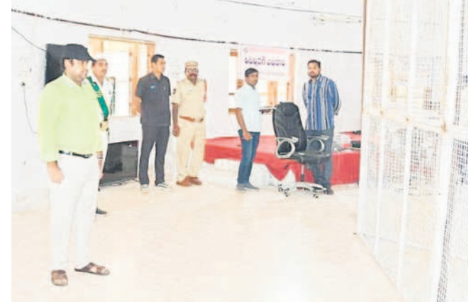
ఆదిలాబాద్ జిల్లాకేంద్రంలోని టీటీడీసీలో ఓట్ల లెక్కింపు ఏర్పాటు పరిశీలిస్తున్న జిల్లా ఎన్నికల అధికారి, కలెక్టర్ రామూల్ రాజ్

ఉమ్మడి జిల్లావ్యాప్తంగా ఓట్ల లెక్కింపునకు సర్వం సిద్ధం