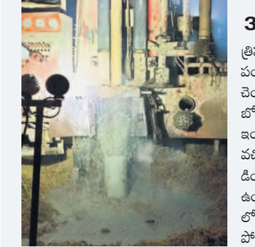
రైతు వెంకటమ్మ పాలంలో వేస్తున్న బోరు

రైతులు కాల్వపై ఆధారపడకుండా త్వరగా వరి నాట్లు పూర్తి చేస్తున్నారు. కరెంట్ అందడం, వడ్లకు ధర ఎక్కువ ఉండడంతో రైతులు వరి నాట్లు వేయడానికి మొగ్గు చూపుతున్నారు. కూలీల కొరత లేకుండా తక్కువ సేద్యం ఉండడంతో ఎండాకాలం రాకముందే నాట్లుకు సిద్ధమయ్యారు. ఈనెల 15 వరకు నాట్లు వేస్తే పిబ్రవరి ఆఖరికల్లా వరి కోతలు కోసకోవచ్చని రైతులు భావిస్తున్నారు.