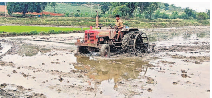
త్రిపురారం మండలం ఫాల్తితండాలో ట్రాక్టర్తో దుక్కి దున్నుతున్న రైతు

హాలియా/ త్రిపురారం, డిసెంబర్ 2: యాసంగిలో వరి సాగుకు రైతులు సిద్ధమవుతున్నారు. సాగర్ నియోజకవర్గంలోని ఆయకట్టు రైతులు వరి నాట్లు వేసుకునేందుకు నారు మడులను సిద్ధం చేసుకున్నారు. గత ఏడాది యాసంగిలో లక్షా 20 వేల ఎకరాల్లో వరి సాగు చేసిన రైతులు ఈ ఏడాది యాసంగిలో సాగర్ జలాశయంలో నీరులేకపోవడంతో లక్ష ఎకరాల్లో వరి సాగు చేసే అవకాశం ఉంది. త్రిపురారం మండలంలోని పలు గ్రామాల్లో రైతులు బోర్లు, బావుల వద్ద వరి నాట్లు ముమ్మరంగా వేస్తున్నారు. బోర్లు 60 నుంచి 70 ఫీట్ల లోతులో పడడం, కొన్నిచోట్ల మోటార్లు మూడు, నాలుగు ఇంచుల్లో కూడా నీళ్లు వస్తుండడంతో