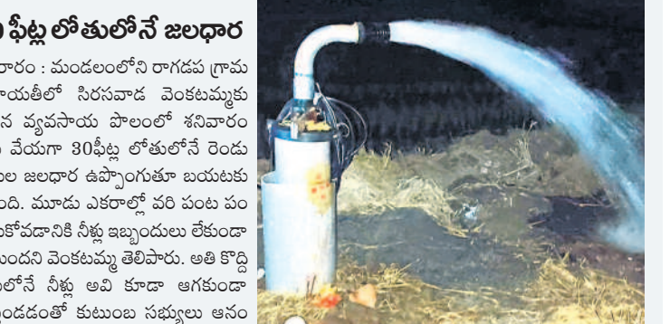
నీటిని పాస్తున్న బోరు