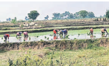
సత్యనారాయణపురంలో వరి నాట్లు వేస్తున్న మహిళలు

రైతులు కాల్వపై ఆధారపడకుండా త్వరగా వరి నాట్లు పూర్తి చేస్తున్నారు. కరెంట్ అందడం, వడ్లకు ధర ఎక్కువ ఉండడంతో రైతులు వరి నాట్లు వేయడానికి మొగ్గు చూపుతున్నారు. కూలీల కొరత లేకుండా తక్కువ సేద్యం ఉండడంతో ఎండాకాలం రాకముందే నాట్లుకు సిద్ధమయ్యారు. ఈనెల 15 వరకు నాట్లు వేస్తే పిబ్రవరి ఆఖరికల్లా వరి కోతలు కోసకోవచ్చని రైతులు భావిస్తున్నారు.