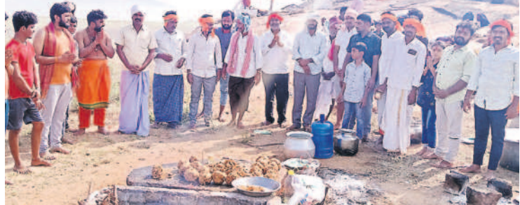
గోపాలస్వామి దేవాలయంలో పూజలు చేస్తున్న గిరిజనులు

నేరెడుగొమ్ము(చందంపేట), డిసెంబర్ 2: మండలంలోని చిన్నమునిగల్ పంచాయతీలో ఉన్న బ్యాంక్ వాటర్ ఒడ్డుపై ఉన్న గోపాలస్వామి దేవాలయంలో శనివారం యాపలపా యతండాకు చెందిన అమ్రవాడకు చెందిన గిరిజనులు ప్రత్యేక పూజలు చేశారు. ప్రతి ఏడాది లాగానే ఈసారి కూడా పూజలు నిర్వహించారు. దేవాలయంలో