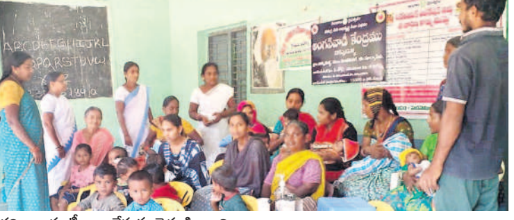
గర్భిణులకు టీకాలు వేస్తున్న వైద్య సిబ్బంది