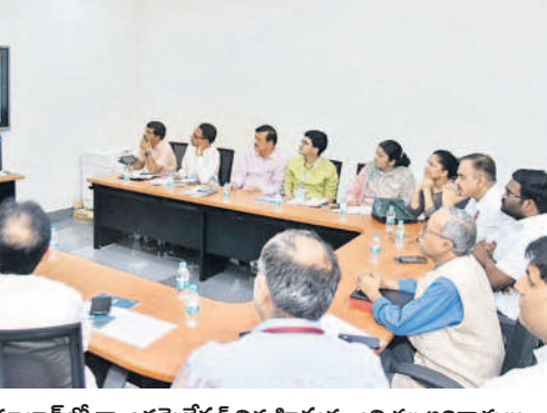
నిజామాబాద్లో ర్యాండమైజేషన్ నిర్వహిస్తున్న ఎన్నికల అధికారులు