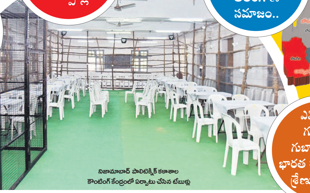
నిజామాబాద్ పాలిటెక్నిక్ కళాశాల కౌంటింగ్ కేంద్రంలో ఏర్పాటు చేసిన టేబుళ్లు