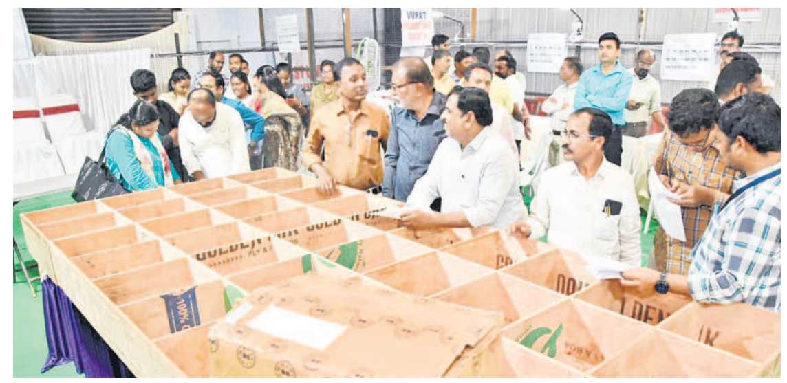
కామారెడ్డిలో కౌంటింగ్ కోసం ఏర్పాటు చేస్తున్న అధికారులు

కామారెడ్డిలో 3 నియోజకవర్గాలకు కౌంటింగ్ ఏర్పాటు