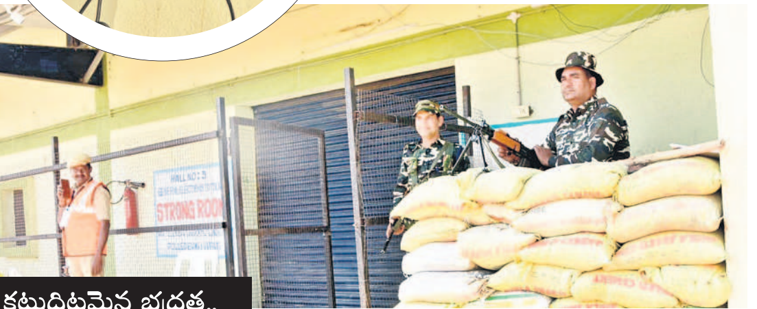
కట్టుదిట్టమైన భద్రత.. నిజామాబాద్ స్టాంగ్ రూమ్ వద్ద పోలీసు బందోబస్తు

ఓటరు ఈవీఎంను నక్సగానే పక్కనున్న వీవీ ప్యాజెట్ సదరు అభ్యర్థి గుర్తుతో ముద్రితమైన చీటీ పడడం ఓటింగ్ వారంతా గమనించే ఉంటారు. నియోజకవర్గాల్లోని ఏవేని ఐదు పోలింగ్ కేంద్రాల వీవీ ప్యాజెట్ చీటీలను చివర్లో లెక్కిస్తారు. ఈవీఎం, వీవీప్యాజెట్ లెక్కింపు సరిపోయినందుకు అలా చేస్తారు. కాస్తా పోలింగ్ కేంద్రాల ఈవీఎంలు ఫలితాల వెల్లడిలో మొరాయిస్తే అప్పుడు వీవీప్యాజెట్ ఓట్లను(మొదటి స్థానంలో అభ్యర్థి, రెండో స్థానంలో అభ్యర్థి మధ్య తక్కువ ఓట్ల వ్యత్యాసం ఉన్నప్పుడు) లెక్కిస్తారు.