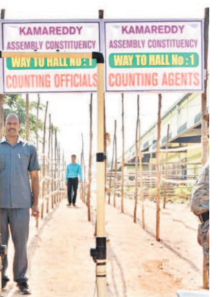
మొదట లెక్కించేది పోస్టల్ బ్యాలెట్..

పోస్టల్ బ్యాలెట్ ఓట్లు, సర్వేస్ ఓట్లను ముందుగా లెక్కిస్తారు. ఈ ప్రక్రియ 8గంటలకు మొదలైతే 20 నుంచి 30 నిమిషాల్లో ఫలితం వెల్లడవుతుందని అధికారులు అంచనా వేస్తున్నారు. తొలుత పోస్టల్ బ్యాలెట్ తర్వాత సర్వేస్ ఓట్లను లెక్కించాలి ఉంటుంది. నితీత వ్యవధిలో పూర్తికాక పోయినా 8.30గంటలకు ఈవీఎంలలో ఓట్ల లెక్కింపు ప్రక్రియ ప్రారంభించే అవకాశాలుంటాయి. అయితే పోస్టల్ బ్యాలెట్ లెక్కింపు పూర్తయితే కానీ ఈవీఎం రౌండ్ల ఫలితాలను అధికారికంగా ప్రకటించడానికి వీల్లేదు. సంబంధిత రిటర్నింగ్ అధికారి పర్యవేక్షణలోనే పోస్టల్ బ్యాలెట్లను లెక్కిస్తారు. ఈవీఎంలలోని ఓట్ల లెక్కింపు టేబుళ్లకు అదనంగా పోస్టల్ బ్యాలెట్ల కోసం ఆర్.ఓ వద్ద ప్రత్యేక టేబుల్ను ఏర్పాటు చేస్తారు. ఈవీఎంలలో సమాధాని ఓట్ల లెక్కింపును నియోజకవర్గానికి 14 టేబుళ్లపై సహాయకులు పోలింగ్ కేంద్రాల ఈవీఎంలకు క్రమపద్ధతిలో తీసుకొచ్చి టేబుళ్లపై ఉంచుతారు. సూపర్వైజర్ వాటిపై ఉండే రిజర్వ్ మీటరు నొక్కి పార్టీల వారీగా సమాధాని ఓట్ల లెక్కింపును చేపడుతుంటారు. మైక్రో అభ్యర్థుల వాటిని పట్టిలో పొందుపర్చి ఆర్.ఓకు అందిస్తారు. అన్ని టేబుళ్ల లెక్కింపు కలిపితే ఓ రౌండ్ ఫలితం వచ్చినట్లు పరిశీలన తర్వాత సంబంధిత ఆర్.ఓ, పరిశీలకులు ఫలితాన్ని వెల్లడిస్తారు. చివరి రౌండ్ ఫలితం పూర్తయ్యాక అభ్యర్థి గెలుపును ఎన్నికల సంఘం అధికారికంగా ప్రకటిస్తుంది. రిటర్నింగ్ అధికారి స్వయంగా గెలుపొందిన వ్యక్తికి ధృవీకరణ పత్రాన్ని అందిస్తారు.