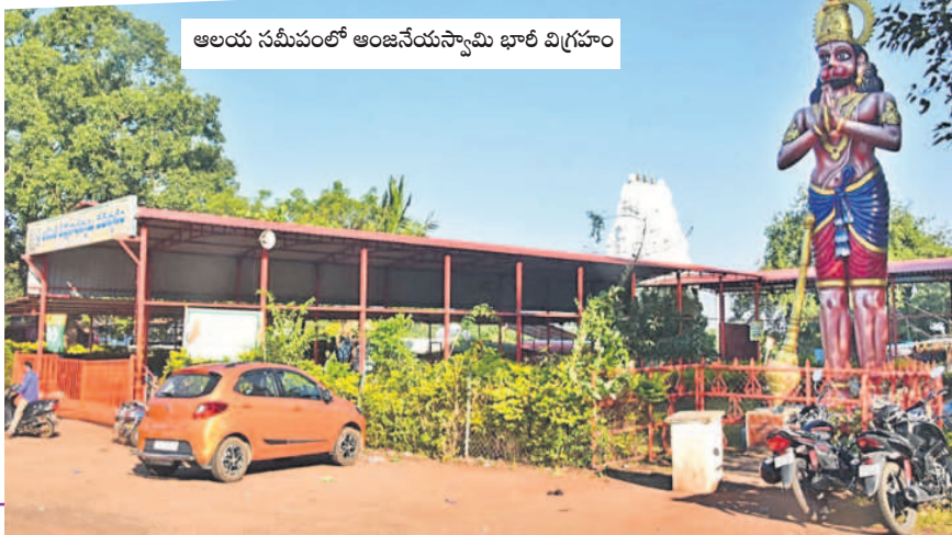
ఆలయ సమీపంలో ఆంజనేయస్వామి భారీ విగ్రహం

స్వామివారిని దర్శించుకునేందుకు ఆలయానికి వచ్చే భక్తుల సౌకర్యార్థం అధికారులు అన్ని ఏర్పాట్లు చేశారు. వాహనాల నిలుపుదలకు పార్కింగ్, తాగునీటి వసతి, మరుగుదొడ్లు, మూత్రశాలలను ఏర్పాటు చేశారు. అంతేకాకుండా వికారాబాద్ నుంచి తాండూరు వెళ్లే వాహనాలను దారి మళ్లించారు. రాత్రి సమయాల్లో ఆలయం వద్ద భక్తులు ఉండేందుకు విద్యుత్ దీపాలను కూడా ఏర్పాటు చేశారు. జాతరలో తినుబండారాలు, ఆట వస్తువులకు స్థలాన్ని ఏర్పాటు చేశారు. ఆలయ ఆవరణలో అద్దె గదులను నిర్మించారు. భగీరథ గుండం వద్ద