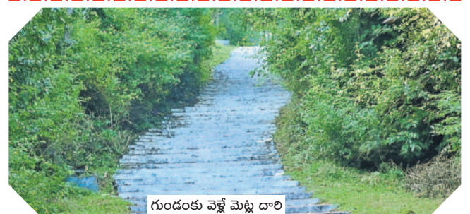
గుండంకు వెళ్లే మెట్ల దారి

మున్సిపాలిటీ ప్రజలే కాదు, జిల్లాలోని చాలామంది రాష్ట్రంలోని పలు నియోజకవర్గాల్లో ఫలితాలపై ఆసక్తిగా ఎదురుచూస్తున్నారు. అందులో ముఖ్యంగా కామారెడ్డి, గజ్వేల్, కొడంగల్, కోరుట్ల, సిరిసిల్ల, ఎల్వీనగర్, మహేశ్వరం, కల్వకుర్తి, మహబూబ్ నగర్, కొల్లాపూర్, మునుగోడు, మేడ్చల్, పాలేరు.. ఇలా మరెన్నో నియోజకవర్గాల్లో ఫలితాలపై ఆసక్తిగా ఉన్నారు. అక్కడ ఎవరు గెలుస్తారు, ఎంత మెజార్టీ వస్తుంది, ఎలా సాధ్యం.. ఇలా పలు అంశాలపై విశ్లేషణలు చేస్తున్నారు. ఆయా నియోజకవర్గాల్లో గెలుపోటములపైనా ఇక్కడ బెట్టింగ్లు పెడుతున్నారు. ఈ బెట్టింగుల ఫలితాలకు మరికొన్ని గంటల్లోనే ఫుల్ స్టాప్ పడనున్నది.