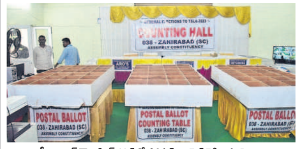
జూపూర్ కౌంటింగ్ హాల్ లో పోస్టల్ బ్యాలెట్ లెక్కింపు టిబుళ్లు