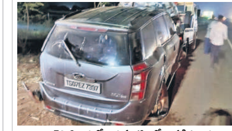
బుచినెల్లి శివారులో అదుపు తప్పి బోల్తా పడిన కారు

జరిగినట్లు పోలీసులు భావిస్తున్నారు. కారులో రూ. 25 లక్షల విలువ చేసే గంజాయి ఉందని గుర్తించారు. రెండు క్వింటాళ్ల గంజాయిని ప్యాక్ చేసి ముంబైకి తరలిస్తున్నారనే అనుమానం వ్యక్తి చేశారు. కారు బోల్తా పడిన ప్రమాదంలో గాయపడిన స్వగర్భులు అక్కడి నుంచి పరారయ్యారన్నారు. చిరాగ్ పల్లి పోలీసులు ప్రమాదం జరిగిన ప్రదేశానికి చేసుకొని కారుతోపాటు గంజాయిని స్వాధీనం చేసుకుని పోలీస్ స్టేషన్ కు తరలించారు. పోలీసులు ఎన్నికల విధుల్లో ఉండడంతో జాతీయ రహదారిపై తనిఖీలు చేయకపోవడంతో స్వగర్భు నిర్ధారంగా గంజాయిని తరలిస్తున్నారనే ఆరోపణలు వస్తున్నాయి. ఈ మేరకు చిరాగ్ పల్లి పోలీసులు కేసు నమోదు చేసి, విచారణ చేస్తున్నారు.