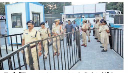
కౌంటింగ్ కేంద్రాల వద్ద భద్రతా ఏర్పాట్లను పరిశీలిస్తున్న పోలీసులు