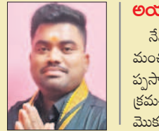
అయ్యప్ప దీక్షతో మంచి ఫలితాలు