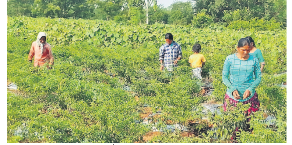
శివాయిపల్లిలో కూరగాయలు తెంపుతున్న మహిళ రైతులు