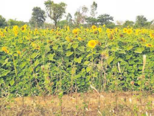
శివాయిపల్లిలో రైతు వేసిన పొద్దుతిరుగుడు పంట

రామాయంపేట, డిసెంబర్ 2: పొద్దు తిరుగుడు పంట రైతులకు లాభనీటిగా మారింది. తక్కువ పెట్టుబడితో రైతులు ఎక్కువ లాభాలు పొందవచ్చు. గతంలో ఈ పంటను చాలా మంది సాగుచేసేవారు. ప్రస్తుత పరిస్థితుల్లో పరి పంట వైపు మళ్ళి సన్నవర్పై రైతులు ఆసక్తి కనబరుస్తున్నారు. యాసంగిలో కూడా ఈ మధ్యలో రైతులు ఎక్కువ శాతం పరి పంట సాగు చేశారు. ప్రస్తుతం వ్యవసాయ శాఖ అధికారులు ప్రత్యామ్నాయ పంటల వైపు మొగ్గు చూపాలని రైతులకు అవగాహన కల్పిస్తున్నారు.