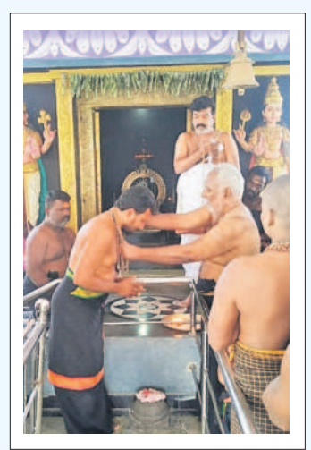
మాలధారణ చేస్తున్న గురుస్వామి (పైట)