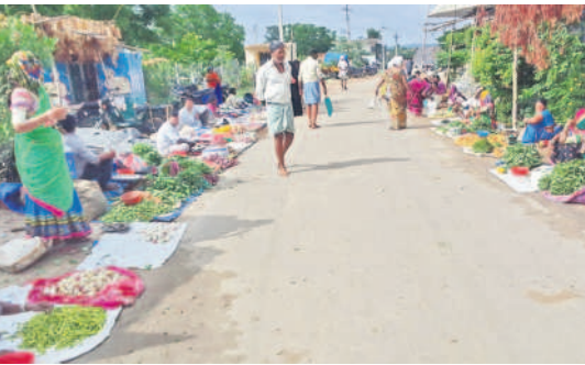
అల్పవార్షికోత్సవంలో గ్రామంలో జరుగుతున్న వారాంతపు సంత(పైట)