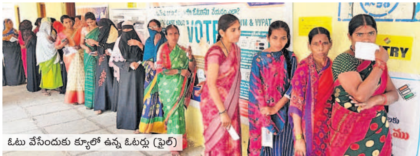
ఓటు వేసేందుకు క్యూలో ఉన్న ఓటర్లు (ఫైల్)

● నేడు ఓట్ల లెక్కింపు ● పోలింగ్ సరళితో మెజార్టీపై కూడికలు, తీసివేతలు