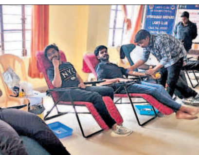
రక్తదానం చేస్తున్న ఎల్లంకి విద్యార్థులు