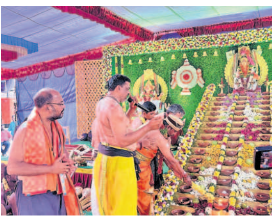
వడ్డెపల్లిలో నిర్వహించిన అయ్యప్పస్వామి మహాపడి పూజ