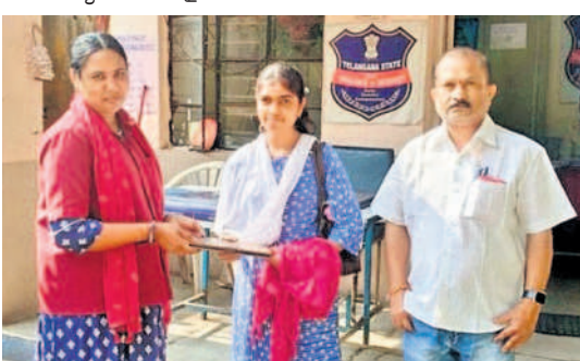
ల్యాప్ ట్యాప్ ను ప్రయాణికురాలికి అందజేస్తున్న కండక్టర్