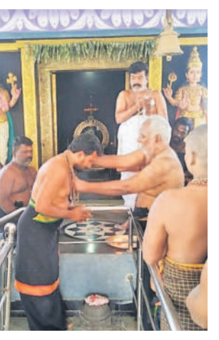
మాలధారణ చేస్తున్న గురుస్వామి (పైట)