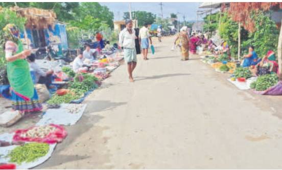
అల్పాహారంలో గ్రామంలో జరుగుతున్న వారాంతపు సంత(పైలెట్)