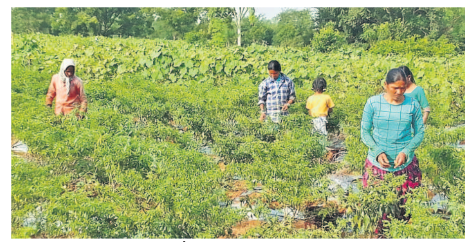
శివాయిపల్లిలో కూరగాయలు తెంపుతున్న మహిళ రైతులు