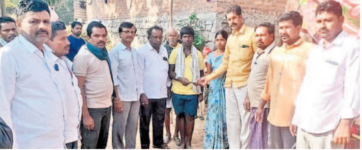
మృతుడి కుటుంబానికి ఆర్థిక సాయం అందజేస్తున్న సర్పంచ్