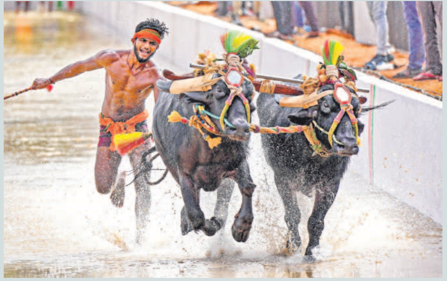
బెంగళూరులోని ప్యాలెస్ గ్రౌండ్ లో కర్ణాటక గ్రామీణ క్రీడ.. 'కంబళ' పోటీలకు సిద్ధం అవుతున్న ఓ రైతు.