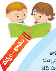
పఠ్యం - భావం

భావం: జనాలు భాగ్యవంతుల దగ్గరికి చాలా దూరం నుంచీ, శ్రమ పడి మరీ.. తామంతట తామే వస్తారు. ఎలాగంటే.. రత్నాలకు నిలయమైన సముద్రంలోకి నదులన్నీ ప్రకృతి సిద్ధంగానే వచ్చి చేరుతాయి కదా! అలాగే సంపదలు ఉన్న వారి దగ్గరికి ఆహ్వానం లేకున్నా.. జనాలు వస్తారని భావం.