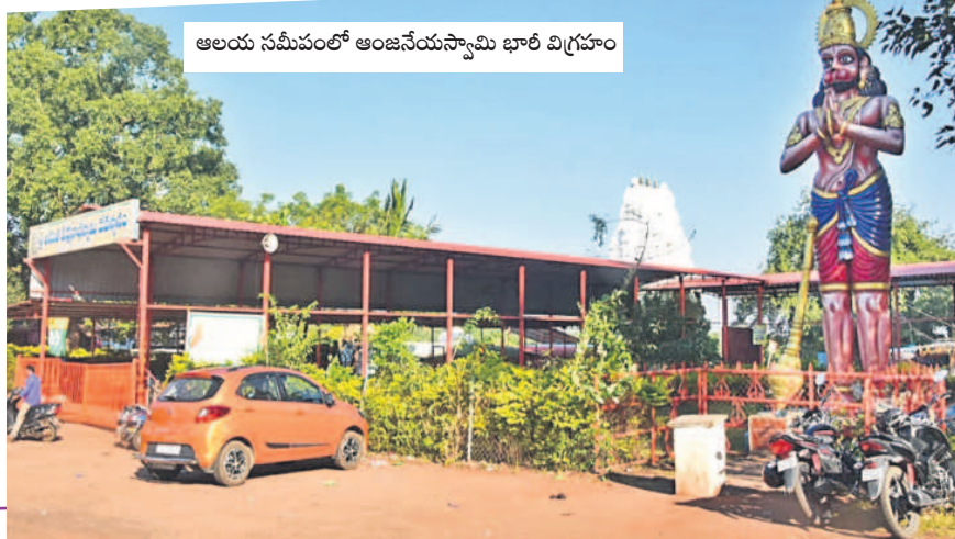
ఆలయ సమీపంలో ఆంజనేయస్వామి భారీ విగ్రహం

స్వామివారిని దర్శించుకునేందుకు ఆలయానికి వచ్చే భక్తుల సౌకర్యార్థం అధికారులు అన్ని ఏర్పాట్లు చేశారు. వాహనాల నిలుపుదలకు పార్కింగ్, తాగునీటి వసతి, మరుగుదొడ్లు, మూత్రశాలలను ఏర్పాటు చేశారు. అంతేకాకుండా వికారాబాద్ నుంచి తాండూరు వెళ్లే వాహనాలను దారి మళ్లించారు. రాత్రి సమయాల్లో ఆలయం వద్ద భక్తులు ఉండేందుకు విద్యుత్ దీపాలను కూడా ఏర్పాటు చేశారు. జాతరలో తినుబండారాలు, ఆట వస్తువులకు స్థలాన్ని ఏర్పాటు చేశారు. ఆలయ ఆవరణలో అద్దె గదులను నిర్మించారు. భగీరథ గుండం వద్ద