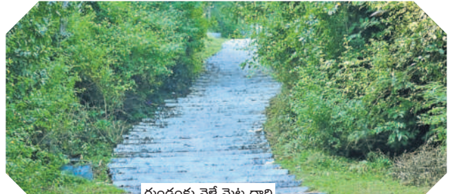
గుండంకు వెళ్లే మెట్ల దారి

మున్సిపాలిటీ ప్రజలే కాదు, జిల్లాలోని చాలామంది రాష్ట్రంలోని పలు నియోజకవర్గాల్లో ఫలితాలపై ఆసక్తిగా ఎదురుచూస్తున్నారు. అందులో ముఖ్యంగా కామారెడ్డి, గజ్వేల్, కొడంగల్, కోరుట్ల, సిరిసిల్ల, ఎల్పీఎన్ గర్, మహేశ్వరం, కల్వకుర్తి, మహబూబ్ నగర్, కొల్లాపూర్, మునుగోడు, మేడ్చల్, పాలేరు.. ఇలా మరెన్నో నియోజకవర్గాల్లో ఫలితాలపై ఆసక్తిగా ఉన్నారు. అక్కడ ఎవరు గెలుస్తారు, ఎంత మెజార్టీ వస్తుంది, ఎలా సాధ్యం.. ఇలా పలు అంశాలపై విశ్లేషణలు చేస్తున్నారు. ఆయా నియోజకవర్గాల్లో గెలుపోటములపైనా ఇక్కడ బెట్టింగ్లు పెడుతున్నారు. ఈ బెట్టింగుల ఫలితాలకు మరికొన్ని గంటల్లోనే ఫుల్ స్టాప్ పడనున్నది.