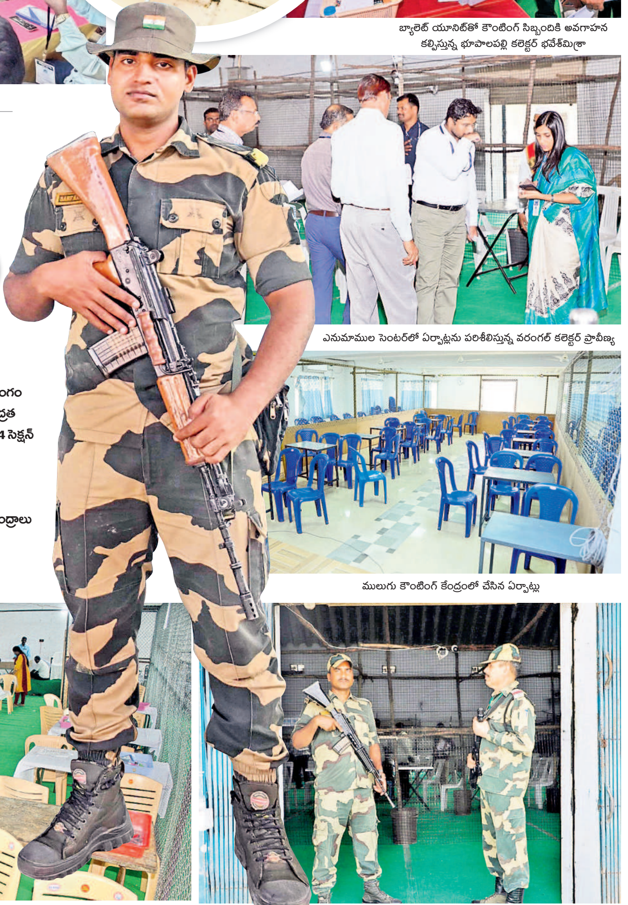
ఎనుమామల సెంటర్లో ఏర్పాట్లను పరిశీలిస్తున్న వరంగల్ కలెక్టర్ ప్రావీణ్య