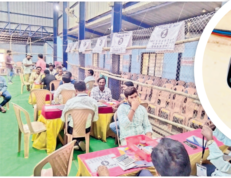
భూపాలపల్లిలో విధుల్లో చేరిన కౌంటింగ్ సిబ్బంది