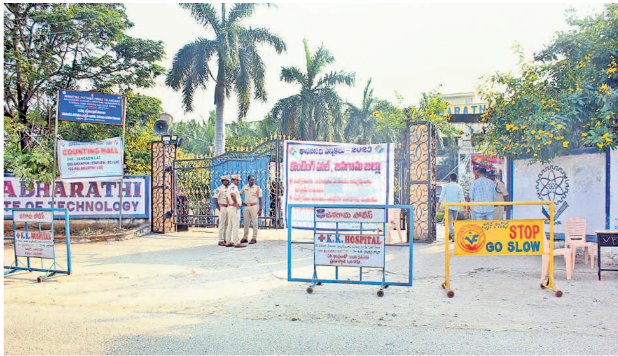
జనగామ జిల్లా పెంబర్లి వీటిబిటీ కళాశాలలో ఏర్పాటుచేసిన కౌంటింగ్ కేంద్రం వద్ద పోలీసుల పహారా