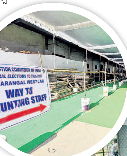
కౌంటింగ్ కేంద్రం వద్ద పూర్వయిన ఏర్పాట్లు

ఓట్ల లెక్కింపు ప్రక్రియకు సర్దుబాటు సిద్ధమైంది. ఆదివారం ఉదయం 8 గంటలకు కౌంటింగ్ ప్రారంభం కానుంది. స్ట్రాంగ్ రూం నుంచి కమిషనరులు, వీవీపాట్లూ, ఇతర ఎన్నికల సామగ్రిని పోలీసు బందోబస్తు మధ్య సిబ్బంది కౌంటింగ్ రూంకు తీసుకెళ్తారు. ముందుగా పోస్టల్ బ్యాల్లెట్ ఓట్లను లెక్కిస్తారు. భూపాలపల్లి సెగ్మెంట్ ఓట్ల లెక్కింపు కార్యక్రమం జిల్లా కేంద్రంలోని అంబేద్కర్ స్టేడియంలోని సింగరేణి మినీ ఫంక్షనల్ హాల్లో నిర్వహించనున్నారు. అలాగే ములుగుకు సంబంధించి ములుగు కలెక్టరేట్లో, మహబూబాబాద్, డోర్నాలో నియోజకవర్గాలవి మహబూబాబాద్లోని సాంఘిక సంక్షేమ గురుకులంలో, జనగామ, పాలకర్తి, స్టేషన్ మనపూర్కు సంబంధించి పెంబర్లిలోని వీటిబిటీ కళాశాలలో, వరంగల్లోని ఎనుమామల వ్యవసాయ మార్కెట్లో వరంగల్ పశ్చిమ, వరంగల్ తూర్పు, వర్ధన్నపేట, పరకాల, నర్సంపేట నియోజకవర్గాల ఓట్లను లెక్కించనున్నారు. కౌంటింగ్ కేంద్రంలో సీసీ కెమెరాలను ఏర్పాటు చేసి భద్రతా సిబ్బంది ప్రత్యేకంగా పర్యవేక్షిస్తున్నారు. 14 టేబుల్ కౌంటింగ్ సిబ్బంది ఓట్లను లెక్కిస్తుండగా అక్కడే ఉన్న కంప్యూటర్ రూంలో ఎప్పటికప్పుడు సిబ్బంది ఆన్లైన్లో సమాధానం చేస్తారు. కౌంటింగ్ హాల్కు ఒక పక్క మీడియా సెంటర్ను, మరో పక్క ఆయా పార్టీల ప్రతినిధులకు, ఎన్నికల సిబ్బందికి ప్రత్యేక హాజీరు కేటాయింపారు. లెక్కింపు ఏర్పాట్లను శనివారం జిల్లా ఎన్నికల అధికారులు సీక్రా పట్టాయక్, ప్రావీణ్య భవేష్ కుమార్, ఇలా త్రిపాటి, శివలింగయ్య, శశాంక పరిశీలించారు. ఎలాంటి ఇబ్బందులు తెలెత్తకుండా చూడాలని సిబ్బందికి సూచనలు చేశారు.