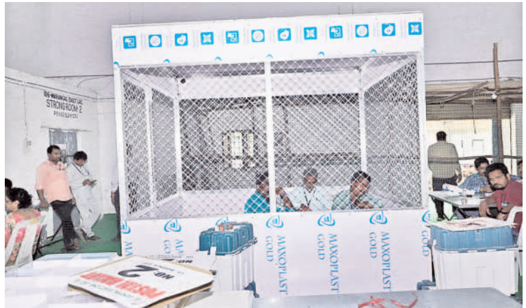
వరంగల్ ఎనుమామల మార్కెట్లో ఏర్పాటుచేసిన కౌంటింగ్