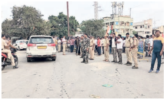
పాల్వంచలో బందోబస్తు దృశ్యాలు