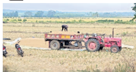
ధాన్యాన్ని తరలిస్తున్న రైతులు

అశ్వారావుపేట టౌన్, డిసెంబర్ 3: రైతుల గుండెల్లో 'తుఫాన్' రేగుతున్నది. అలజడి సృష్టస్తున్నది. కంటి మీద కుసుకు లేకుండా చేస్తున్నది. తుఫాన్ ప్రభావంతో బారీ వర్షాలు కురుస్తాయన్న హెచ్చరికలతో రైతులు అప్రమత్తమయ్యారు. ఇప్పటికే కోతకు వచ్చిన వరి పంటను యంత్రంతో కోయిస్తున్నారు. కోసిన ధాన్యాన్ని ఆరబెడుతున్నారు. పొలంలోని ధాన్యాన్ని మెరక ప్రదేశానికి తరలించి పరదాలు కప్పతున్నారు. వర్షం