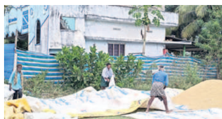
ధాన్యం పరదాలు కప్పతున్న రైతులు

అశ్వారావుపేట టౌన్, డిసెంబర్ 3: రైతుల గుండెల్లో 'తుఫాన్' రేగుతున్నది. అలజడి సృష్టస్తున్నది. కంటి మీద కుసుకు లేకుండా చేస్తున్నది. తుఫాన్ ప్రభావంతో బారీ వర్షాలు కురుస్తాయన్న హెచ్చరికలతో రైతులు అప్రమత్తమయ్యారు. ఇప్పటికే కోతకు వచ్చిన వరి పంటను యంత్రంతో కోయిస్తున్నారు. కోసిన ధాన్యాన్ని ఆరబెడుతున్నారు. పొలంలోని ధాన్యాన్ని మెరక ప్రదేశానికి తరలించి పరదాలు కప్పతున్నారు. వర్షం