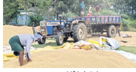
ధాన్యాన్ని ఆరబోస్తున్న రైతులు

కురిస్తే తమ పంట దెబ్బతింటుందేమోనని పత్తి, పొగాకు రైతులు కూడా భయపడుతున్నారు. చంద్రగౌండ, డిసెంబర్ 3: భారీ వర్షం ఉంటుందన్న హెచ్చరికలు, వాతావరణ మార్పులతో వరి, పత్తి రైతుల గుండెల్లో దడ మొదలైంది. యంత్రంతో వరి కోసేందుకు వారం రోజులు పడుతుంది. ఈలోగా భారీ వర్షం కురిస్తే.. చేతికొచ్చిన పంటంతా దెబ్బతింటుందేమోనని రైతులు భయపడుతున్నారు.