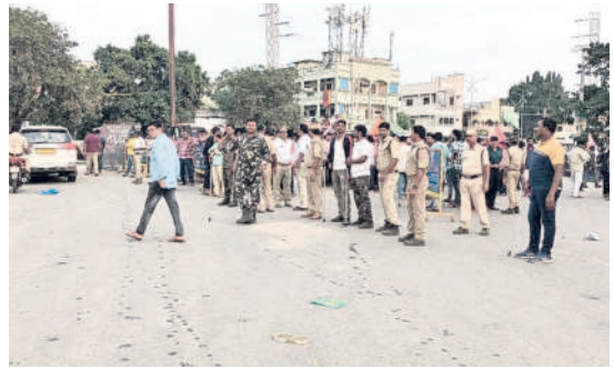
పాల్వంచలో బందోబస్తు దృశ్యాలు